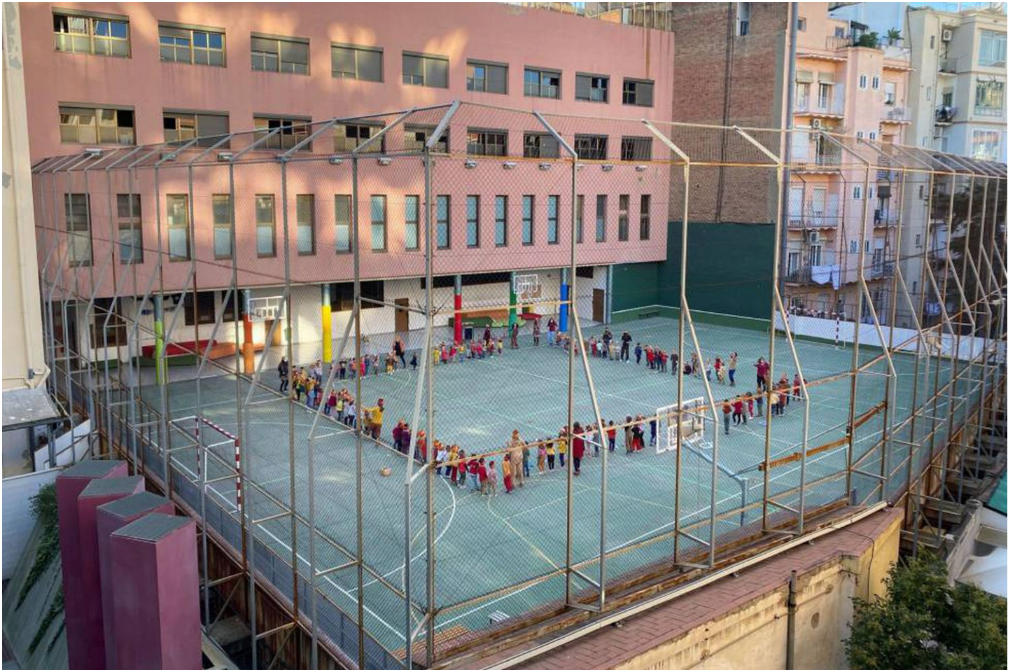
Alumnos de un colegio del centro de Barcelona celebran en el patio la tradicional Castanyada.