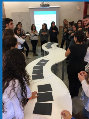
Jocs i activitats transferibles a l'escola