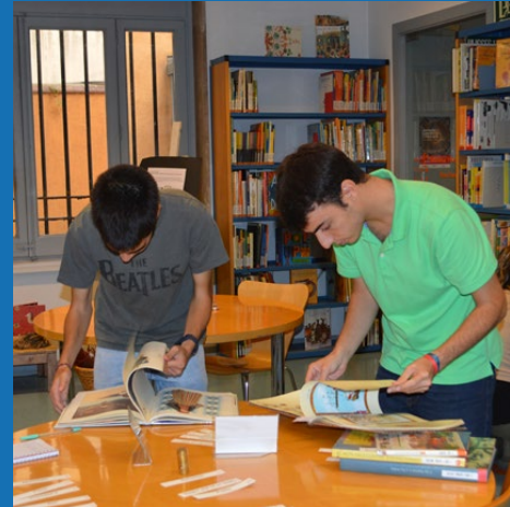
Visita i activitat a la Biblioteca Infantil de l'Associació de Mestres Rosa Sensat