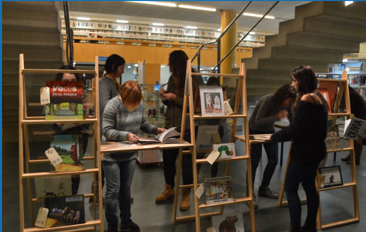
Disseny i muntatge exposició «25 imperdibles»