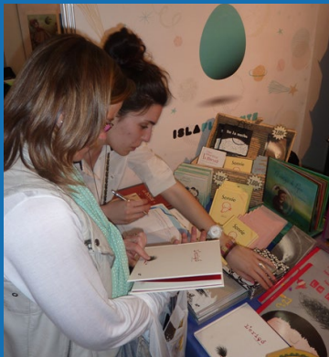
Sortida al Saló del Còmic