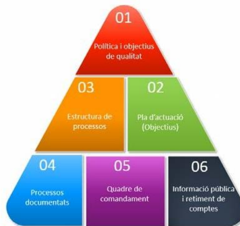
Figura 1. Estructura del SAIQU 2019

Tots els centres propis de la UB disposen d'un model general de SAIQU, que s'estructura en 6 eixos: