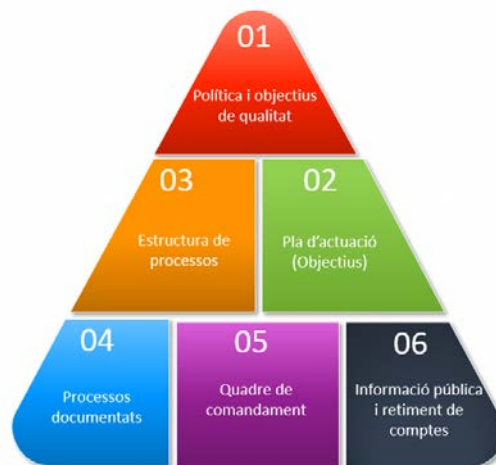
Figura 1. Estructura del SAIQU 2019

Tots els centres propis de la UB disposen d'un model general de SAIQU, que s'estructura en 6 eixos: