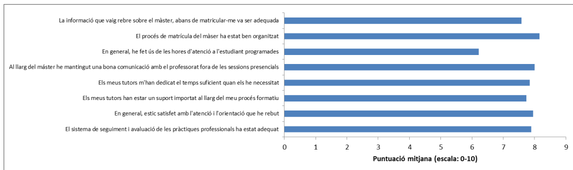
Figura E.5.1: Valoració dels estudiants sobre l'orientació rebuda. Promoció 2013-15.

En General, es considera que les accions dutes a terme en l'orientació acadèmica dels estudiants són adequades per a les seves necessitats. La comissió coordinadora del màster recull cada curs la valoració dels estudiants sobre diferents aspectes. A la Figura E.5.1 es recullen les puntuacions dels alumnes sobre diversos aspectes analitzats en aquest estàndard. Totes les puntuacions es troben entre 7 i 8 punts, excepte l'ús que fan de les hores d'atenció (6,21 punts) i el procés de matrícula (8,16 punts). Els estudiants informen estar satisfets amb l'atenció i l'orientació rebuda ( 7,95 punts).