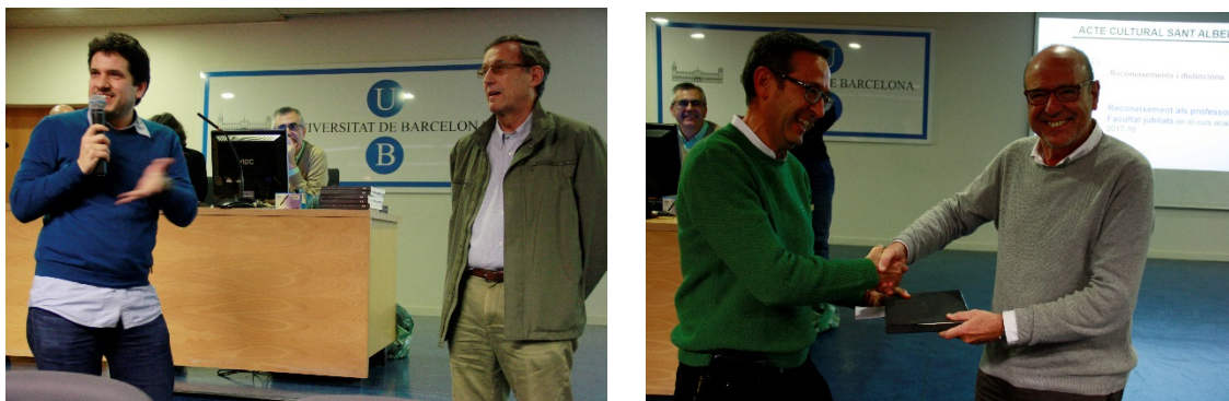
Reconeixement a alguns dels professors que s'han jubilat durant el curs 2018-19.

A continuació es va fer un reconeixement als professors jubilats durant aquest curs. Companys seus van fer un retrat ben personal dels professors referint-se a la seva personalitat, explicant alguna anècdota, destacant moments concrets de la seva trajectòria professional o ressaltant-ne la seva qualitat humana.