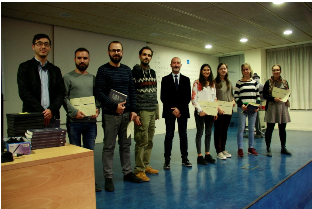
Els doctors que van assistir a l'acte amb el degà de la Facultat de Química.

L'endemà, en l'acte de Sant Albert, es va fer coincidir un programa atapeït però molt emocionant. Amb una Aula Magna ben plena, després del lliurament de premis als tres doctorands guanyadors de la I Tesimarató, que van exposar per segona vegada la seva recerca en quatre minuts, es van lliurar els obsequis i diplomes als doctors del curs 2017-18.