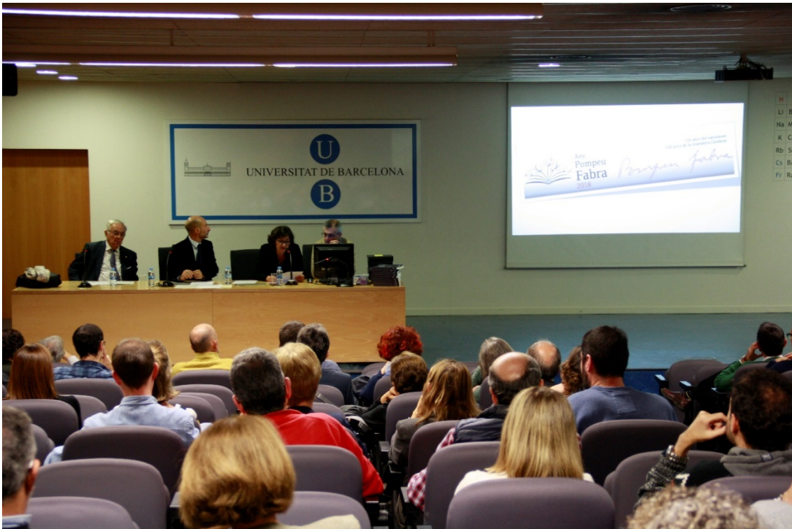
Un moment de l'acte de Sant Albert a la Facultat de Química.

L'endemà, en l'acte de Sant Albert, es va fer coincidir un programa atapeït però molt emocionant. Amb una Aula Magna ben plena, després del lliurament de premis als tres doctorands guanyadors de la I Tesimarató, que van exposar per segona vegada la seva recerca en quatre minuts, es van lliurar els obsequis i diplomes als doctors del curs 2017-18.