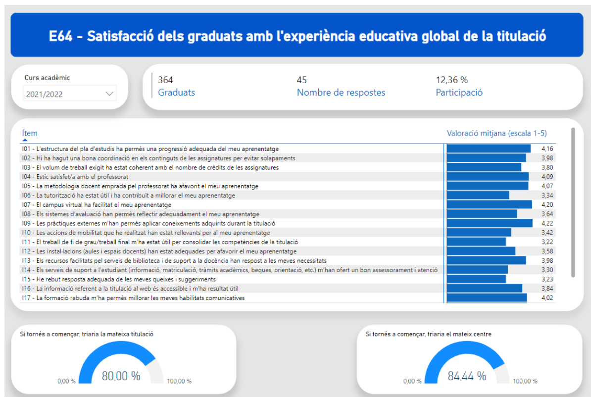
Taula E.6.4. Satisfacció dels graduats amb l'experiència educativa global de la Curs 2021-2022

Unitat proveïdora: https://www.ub.edu/indicadorsVSMa/bi/