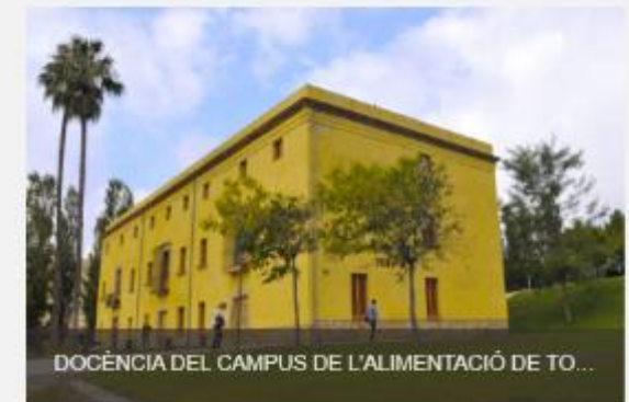
DOCÈNCIA DEL CAMPUS DE L'ALIMENTACIÓ DE TO...