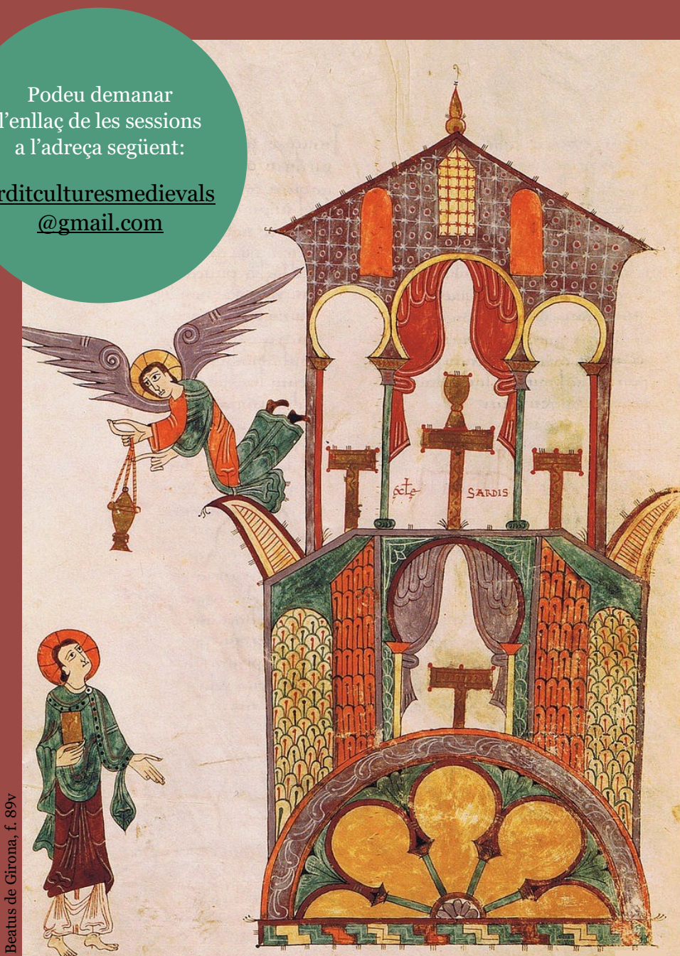
Beatus de Girona, f. 89v