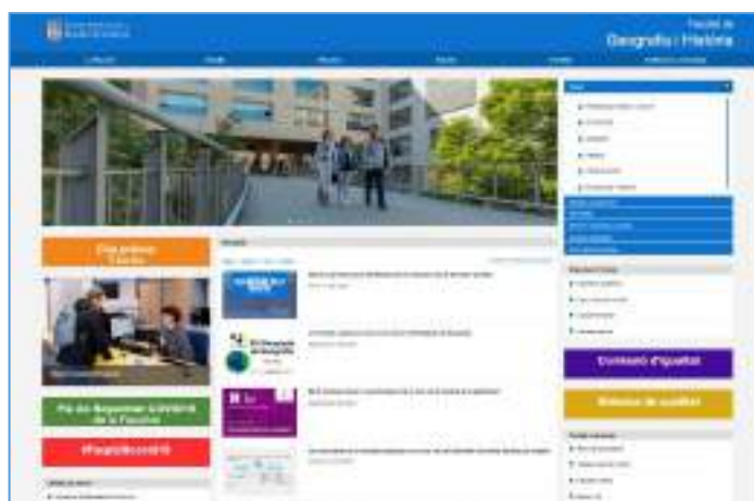
FIGURA 2.1: PÀGINA WEB DE LA FACULTAT DE GEOGRAFIA I HISTÒRIA.