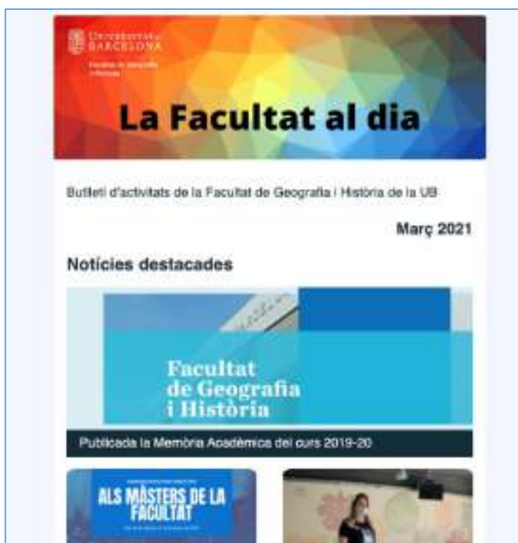
FIGURA 2.5: BUTLLETÍ INFORMATIU DE LA FACULTAT DE GEOGRAFIA I HISTÒRIA: LA FACULTAT AL DIA. MARÇ DEL 2021.