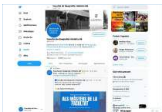
FIGURA 2.2: PERFIL DE TWITTER @GIH_UB.

Més enllà dels canals genèrics de la facultat, on es pot trobar tota la informació tant de graus com de màsters, la majoria dels ensenyaments tenen perfils propis a les xarxes socials amb la finalitat de fer arribar les seves informacions menors i més immediates de manera directa i poder-se dirigir a la comunitat no-universitària. És el cas de Twitter ( @GeografiaUB , @AntropologiaUB , @MasterEAHA i @MasterPatrimoni ) i Instagram ( @GeografiaUB ).