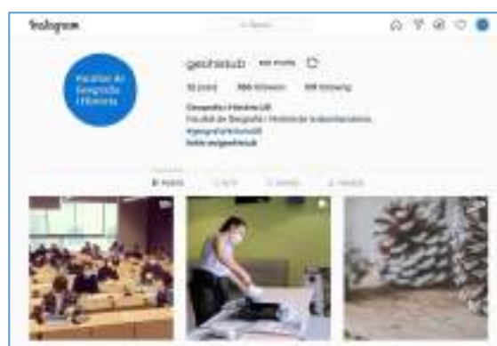
FIGURA 2.3: PERFIL D'INSTAGRAM @GEOHISTUB.