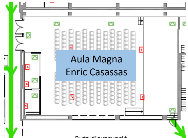
Ruta d'evacuació C/Pau Gargallo