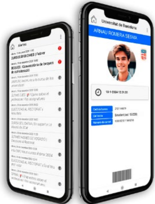
Carnet digital UB

Es pot obtenir a través de l' app SocUB http://www.ub.edu/carnet/ca/alumnat.html