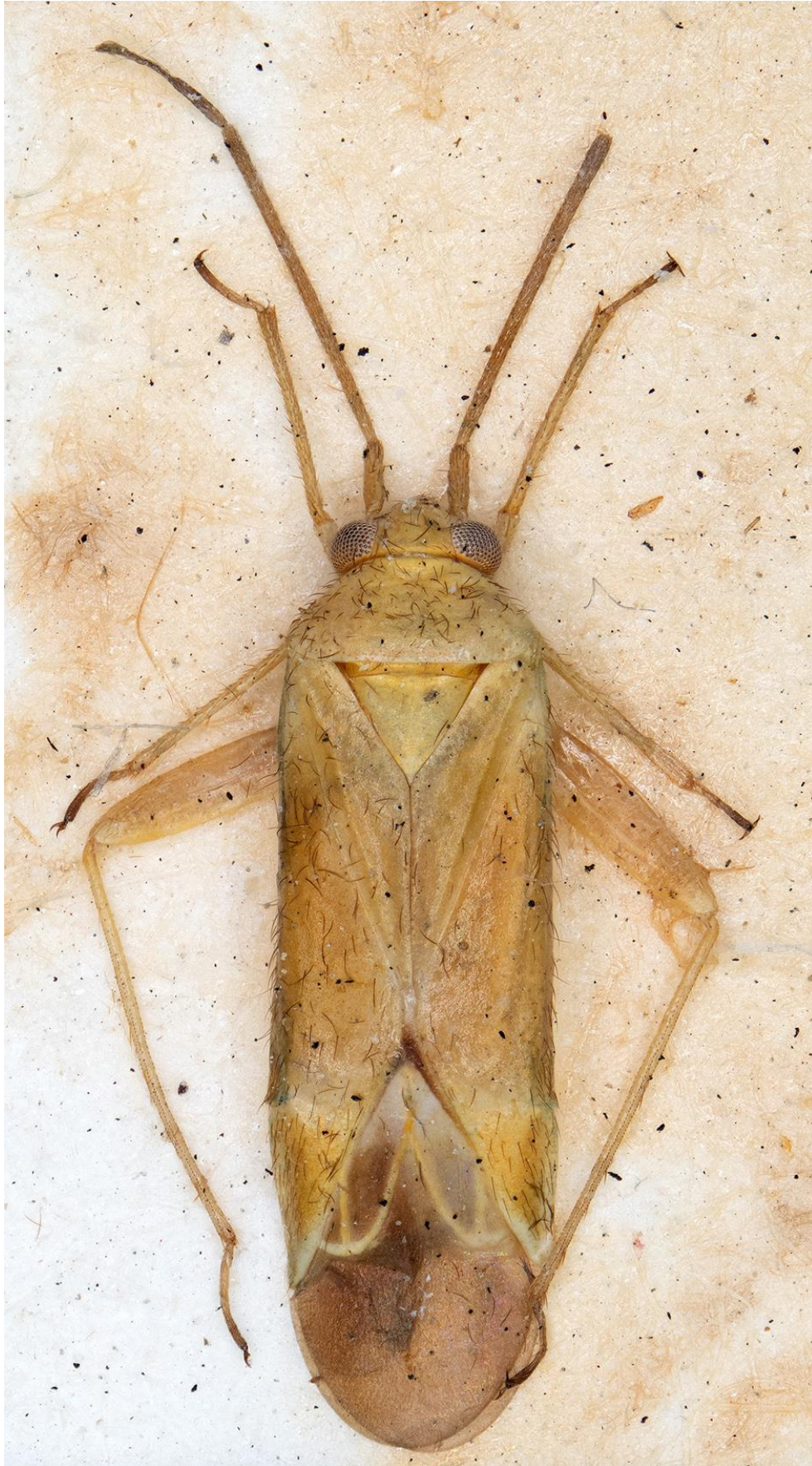
Figura 24. Orthotylus (Pachylops) blascoi Ribes, 1991. Holotipus ♂ (CRBA-72733)