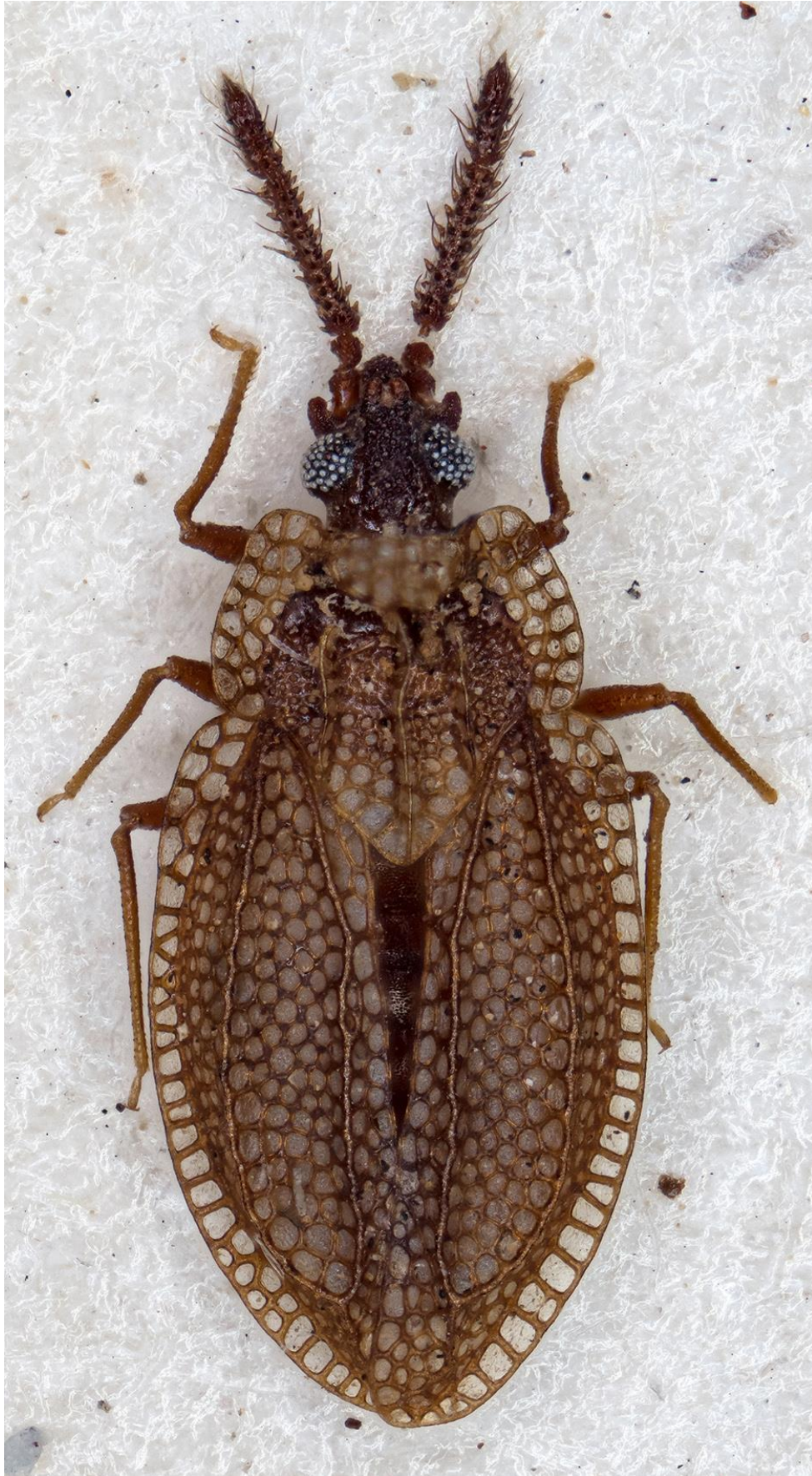
Figura 44. Kalama moralesi (Ribes, 1975). Holotipus ♂ (CRBA-76050)