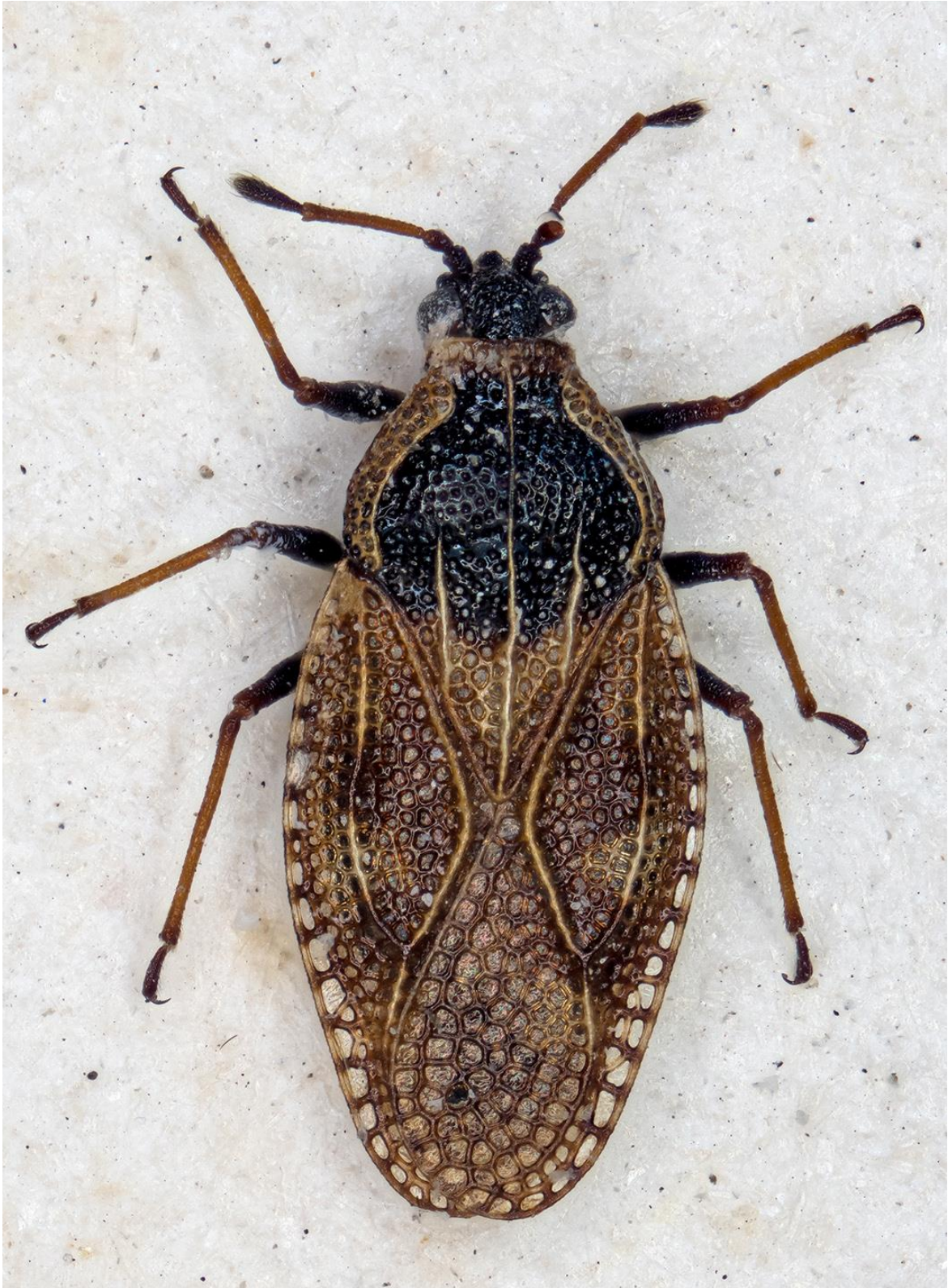
Figura 42. Dictyla lithospermi Ribes, 1967. Holotipus ♂ (CRBA-76312)