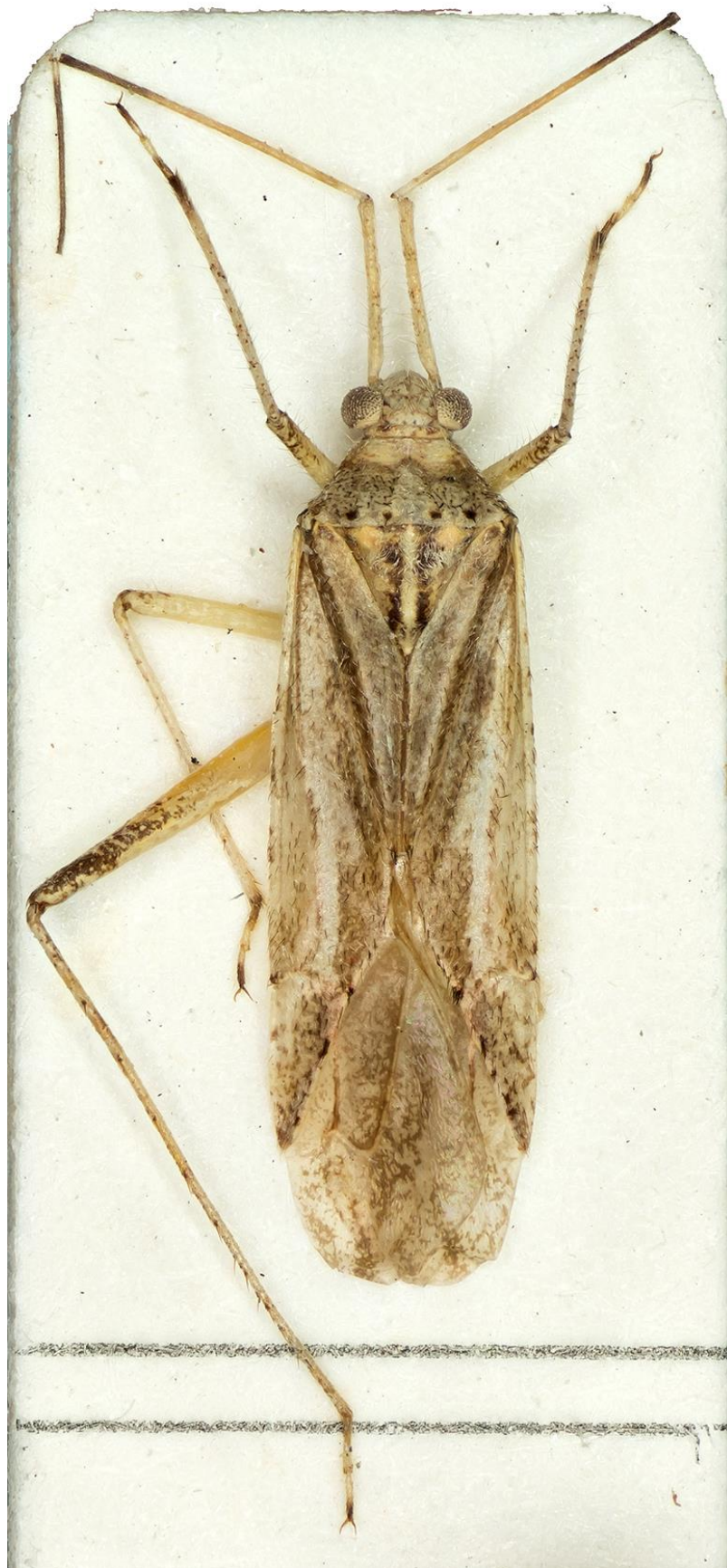
Figura 29. Phytocoris (Compsocerochoris) degregorioi J. Ribes & E. Ribes, 2002. Holotipus ♂ (CRBA-70508)