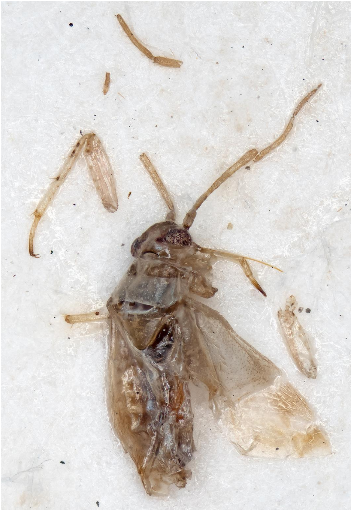
Figura 7. Atomoscelis pictifrons Ribes, Pagola-Carte & Heiss, 2008. Holotipus ♂ (CRBA-73251)