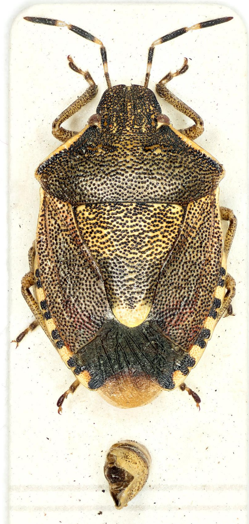
Figura 36. Holcostethus evae Ribes, 1988. Holotipus ♂ (CRBA-59569)