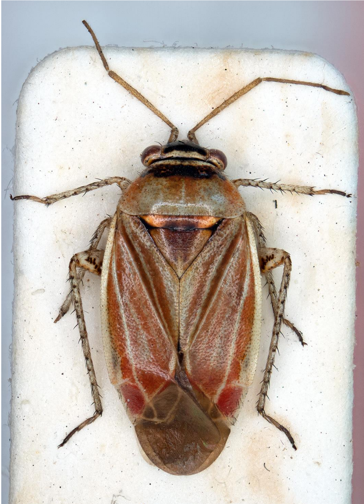
Figura 26. Pachyxyphus yelamosi J.Ribes & E. Ribes, 2000. Holotipus ♂ (CRBA-74520)