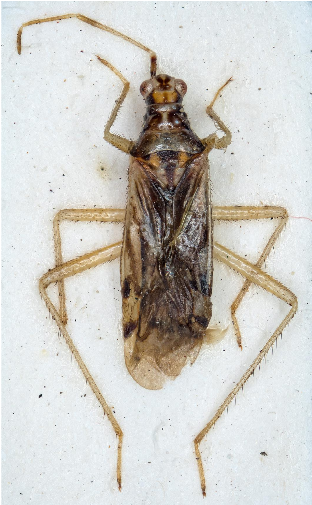
Figura 12. Dicyphus (Dicyphus) baezi Ribes, 1983. Holotipus ♂ (CRBA-69171)