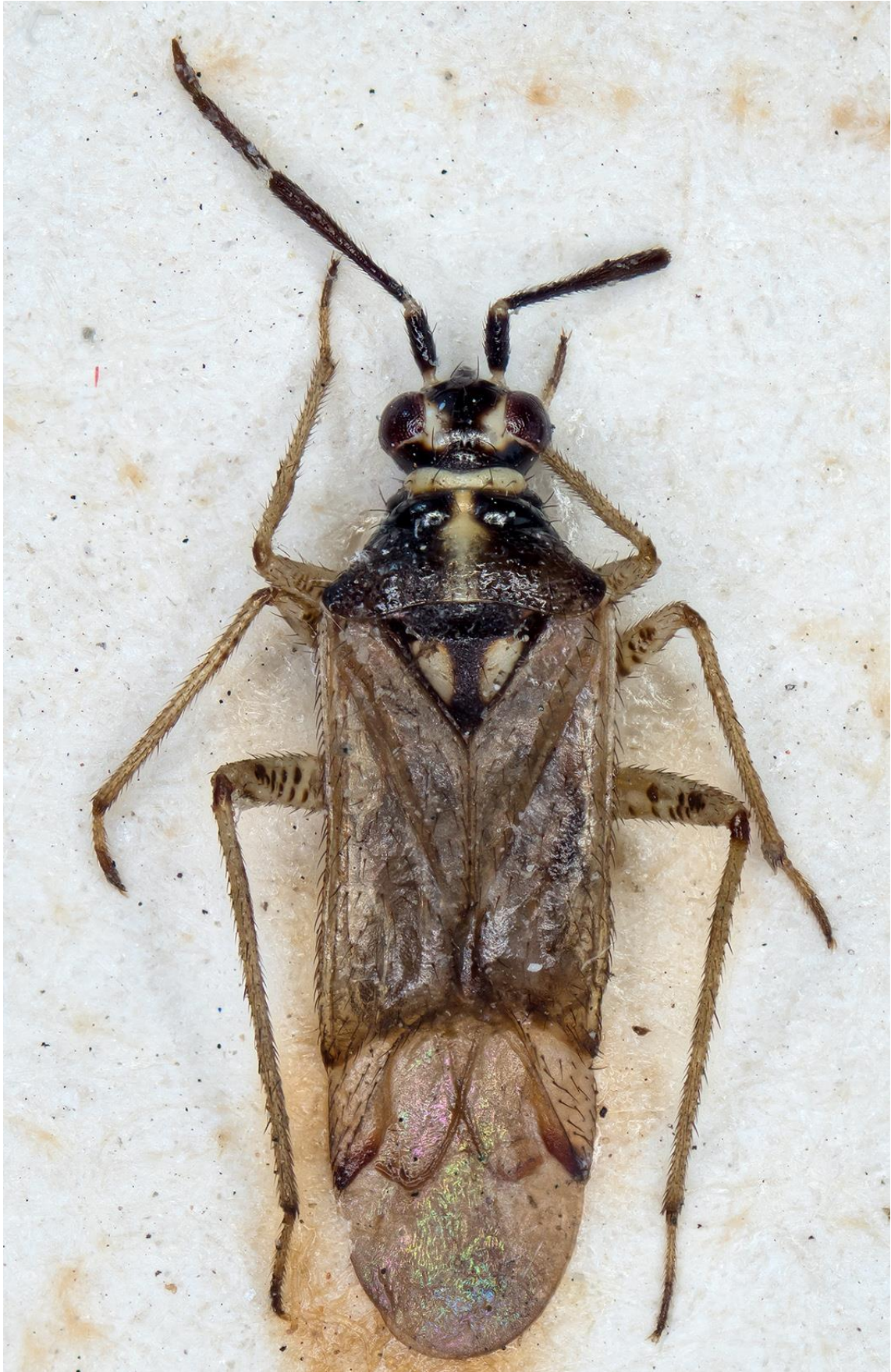
Figura 10. Dicyphus (Brachyceroea) heissi Ribes & Baena, 2006. Holotipus ♂ (CRBA-69166)