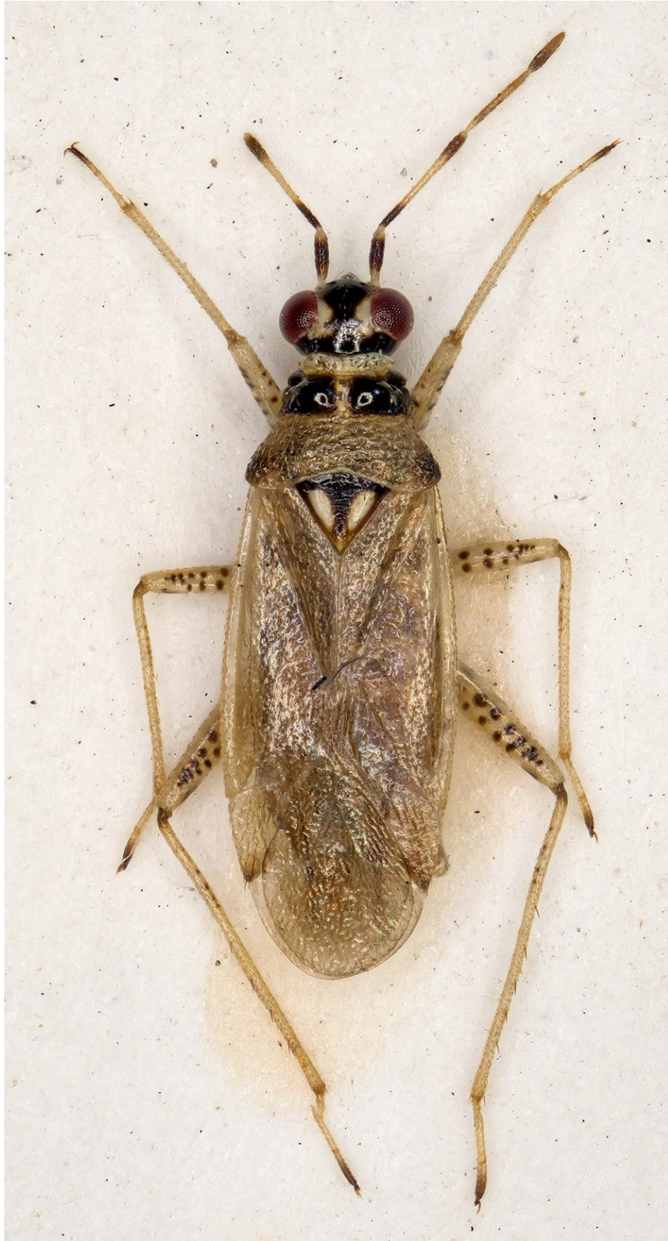
Figura 11. Dicyphus (Brachyceroea) matocqi Ribes & Baena, 2006. Paratipus ♂ (CRBA-69168)