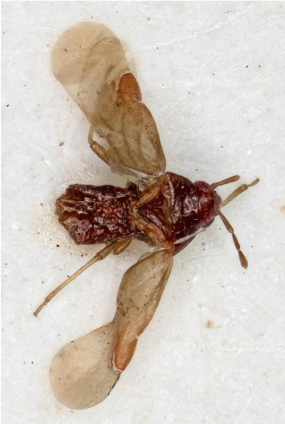
Figura 5. Loricula (Myrmedobia) blascoi (Ribes & Péricart, 1995). Holotipus ♀ (CRBA-69045)