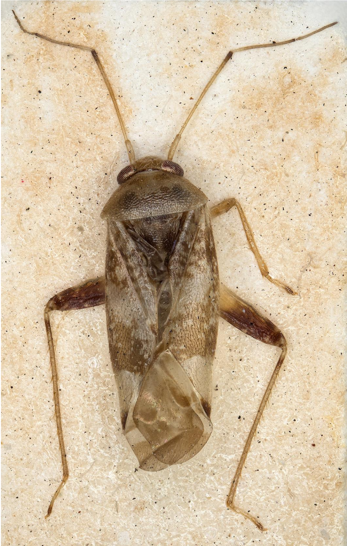
Figura 33. Pinalitus oromii Ribes, 1992. Alotipus ♀ (CRBA-71098)