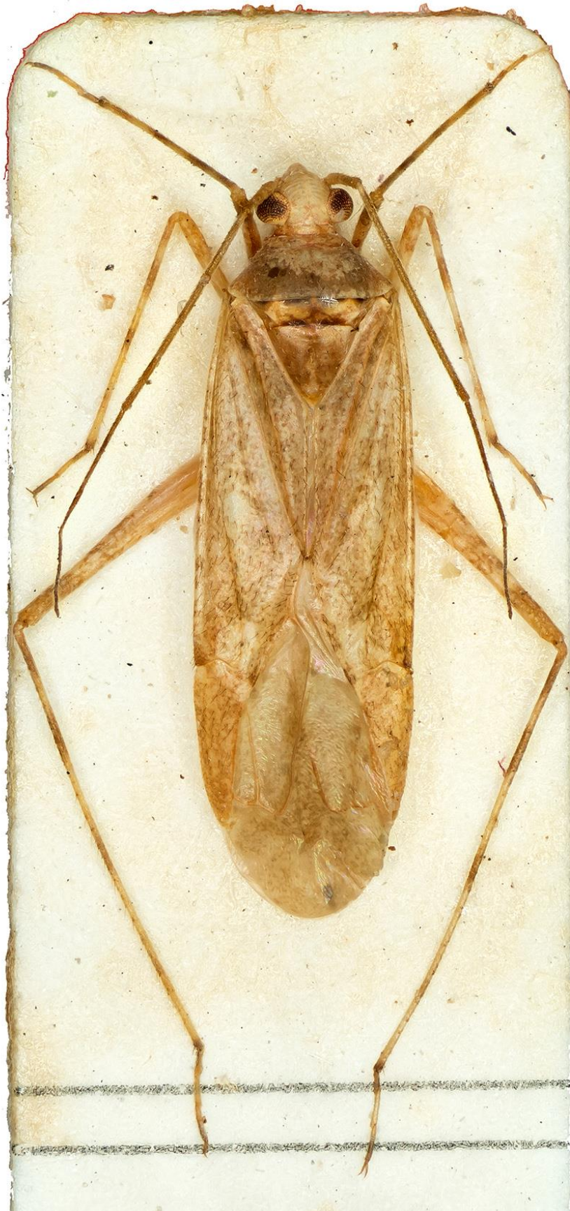
Figura 28. Phytocoris (Compsocerochoris) arenivagus J. Ribes & E. ribes, 1994. Holotipus ♂ (CRBA-70507)