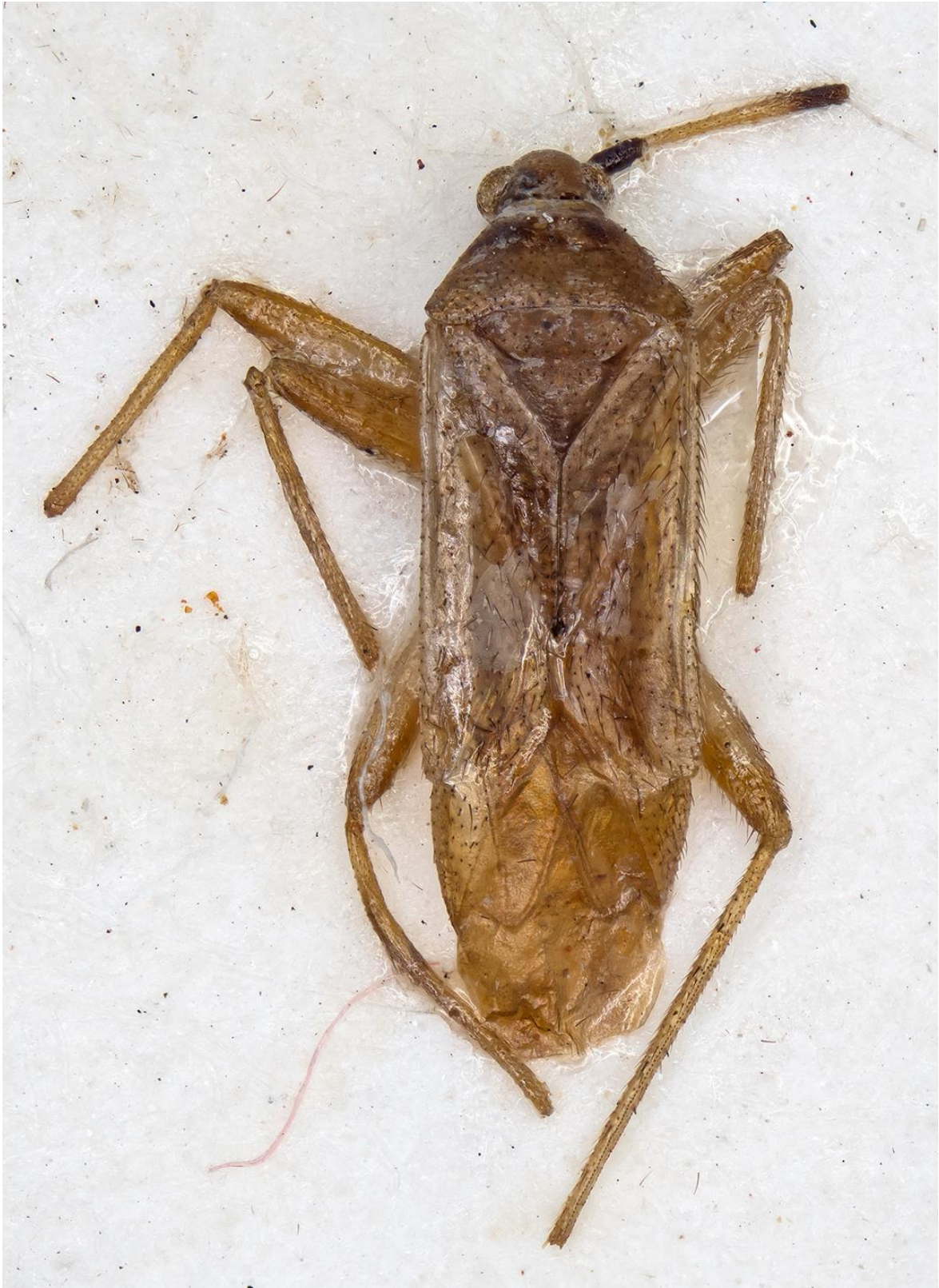
Figura 8. Campyloneuropsis fulva Ribes & Ribes, 2001. Holotipus ♂ (CRBA-69098)