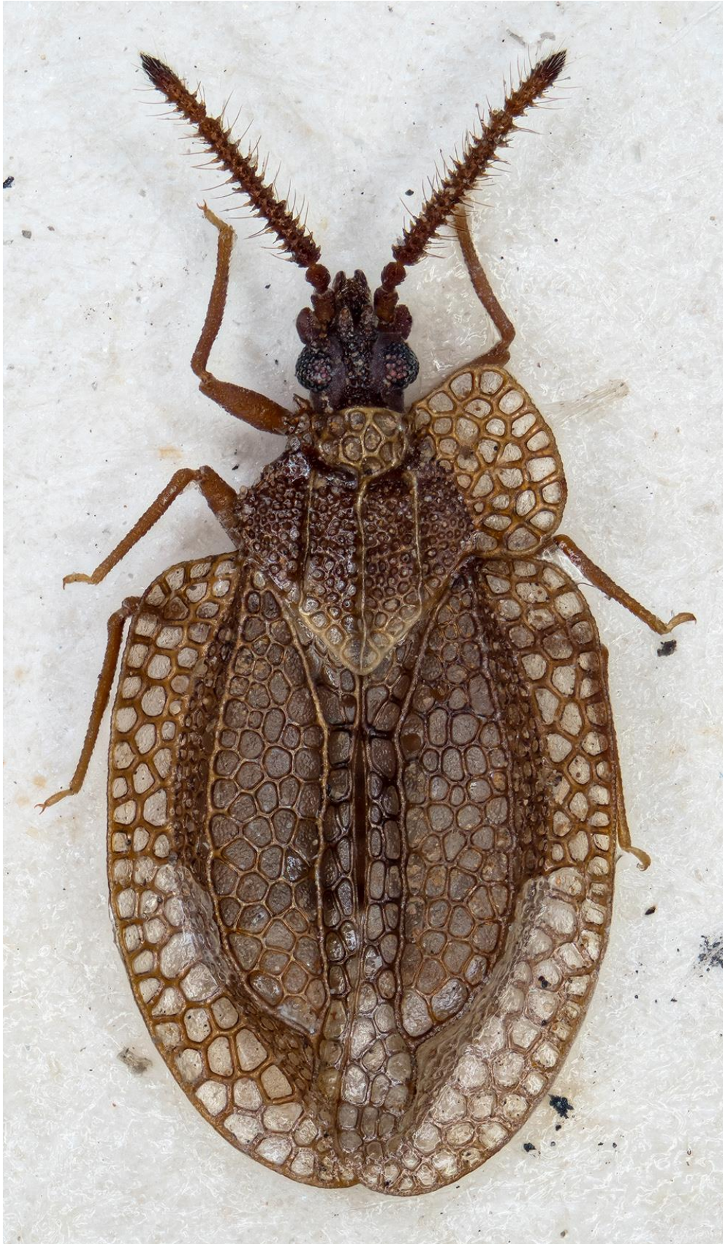
Figura 45. Kalama oromii (Ribes, 1978). Holotipus ♂ (CRBA-76054)