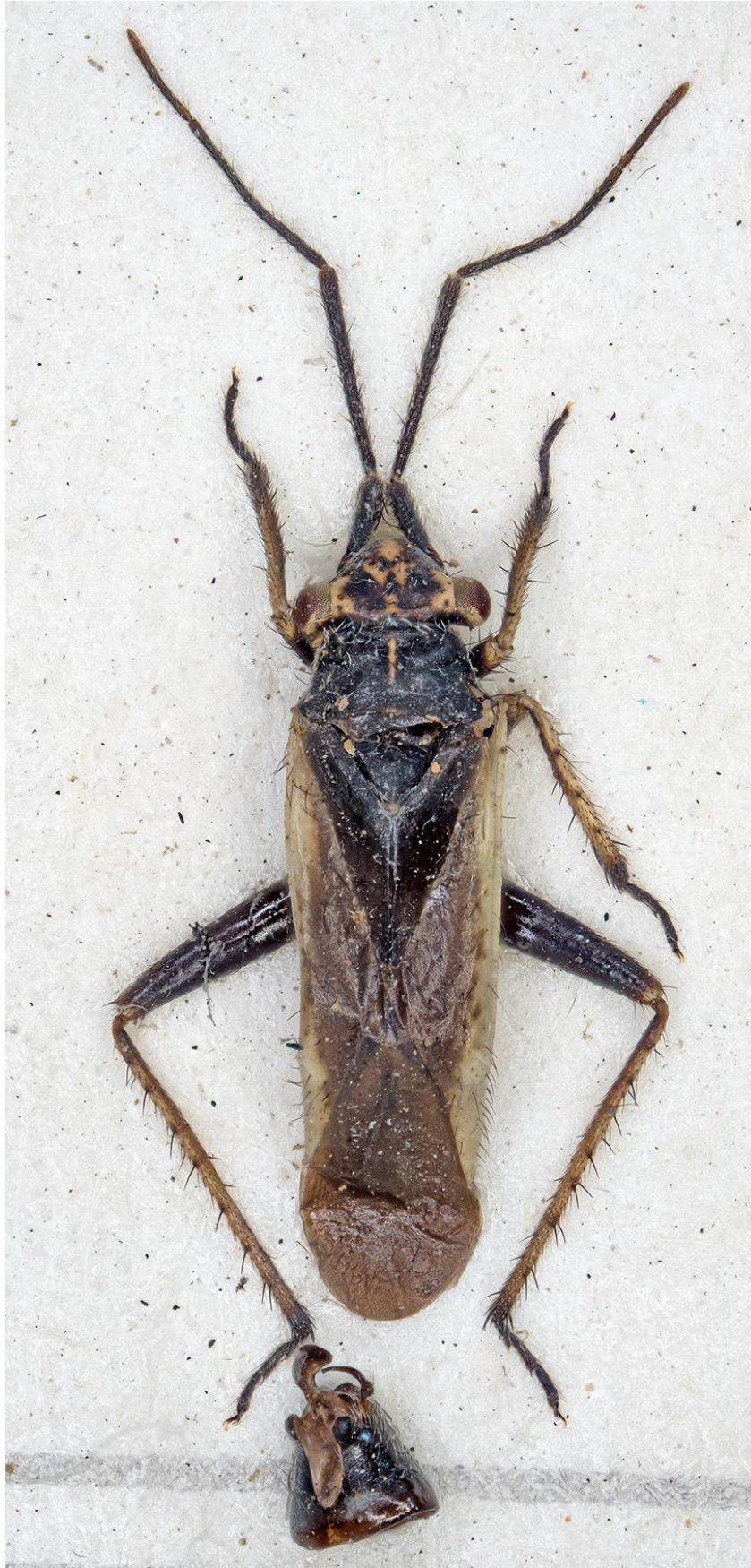
Figura 17. Dimorphocoris (Dimorphocoris) goulae Ehanno & Ribes, 1994. Paratipus ♂ (CRBA-71677)