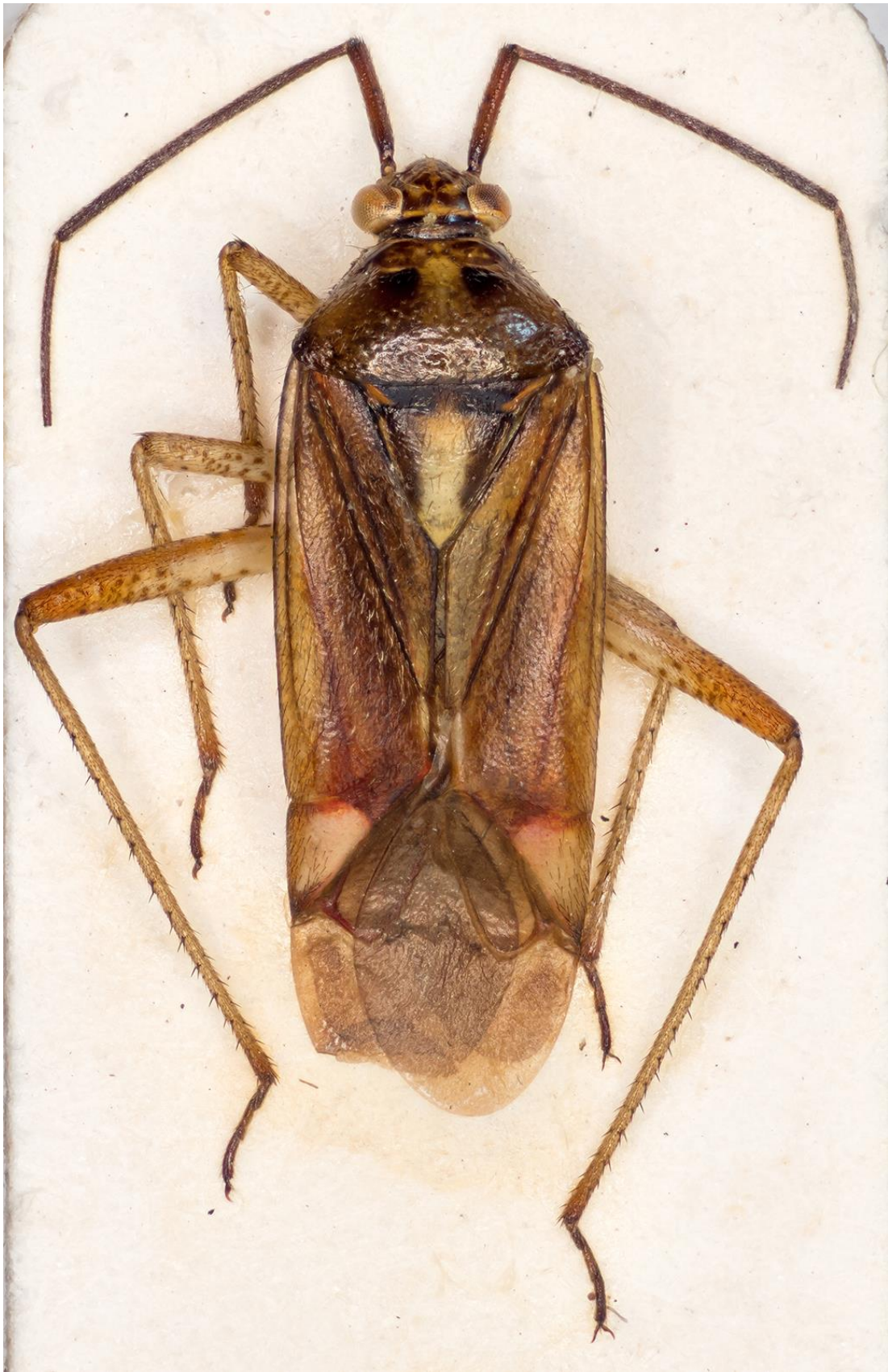
Figura 9. Closterotomus valcarceli Ribes & Ribes, 2003. Paratipus ♂ (CRBA-69951)