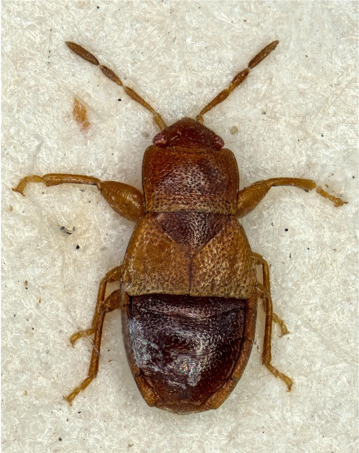
Figura 41. Plinthisus (Nanoplinthisus) magnieni Péricart & Ribes, 1994. Paratipus ♀ (CRBA-65772)