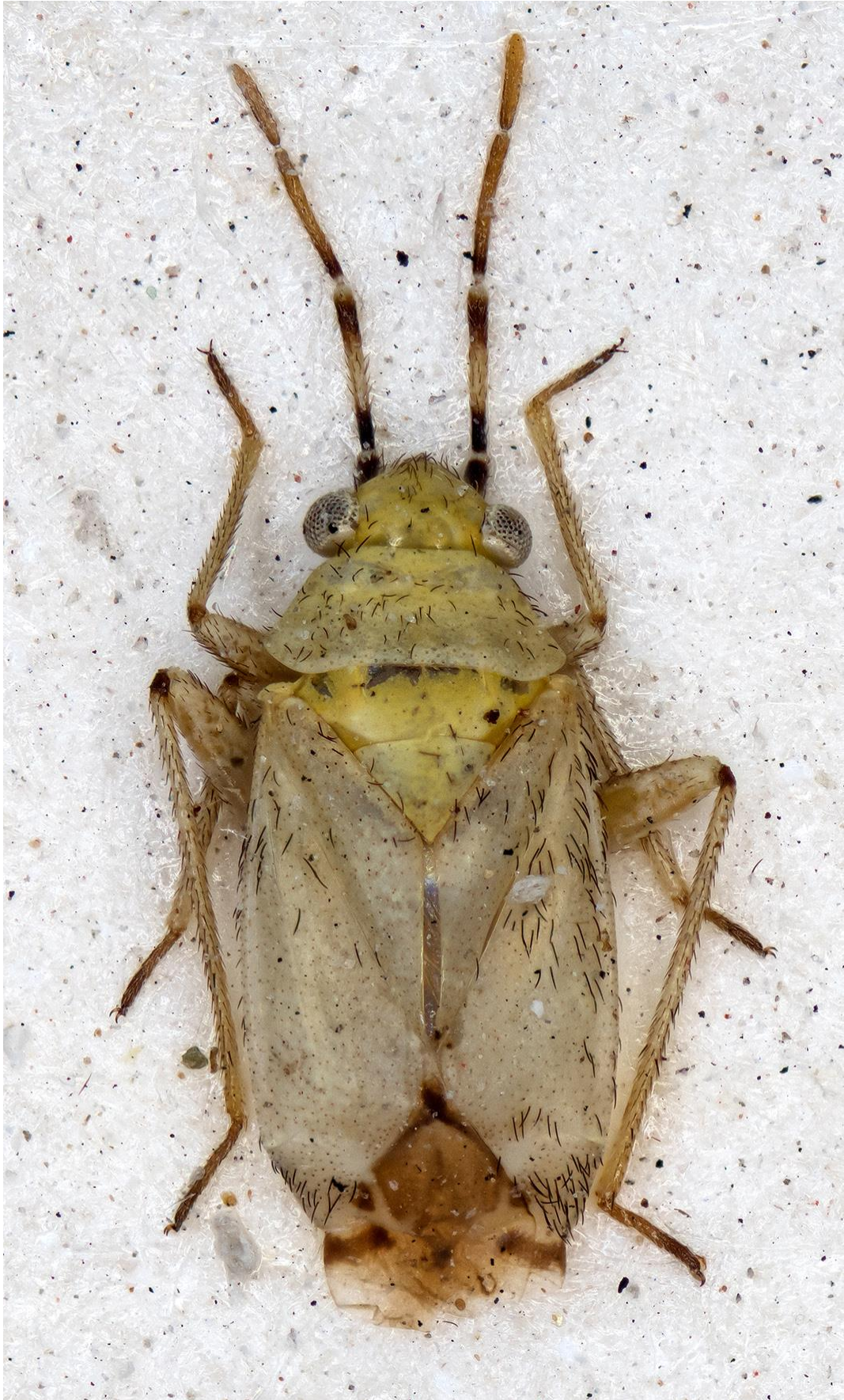
Figura 23. Macrotylus (Alloeonycha) josephinae Ribes, 1978. Holotipus ♂ (CRBA-74091)