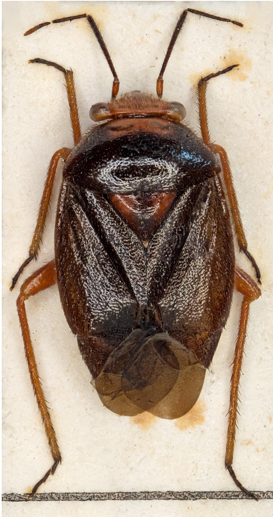
Figura 34. Strongylocoris ferreri Ribes & Pagola-Carte, 2007. Holotipus ♂ (CRBA-72063)