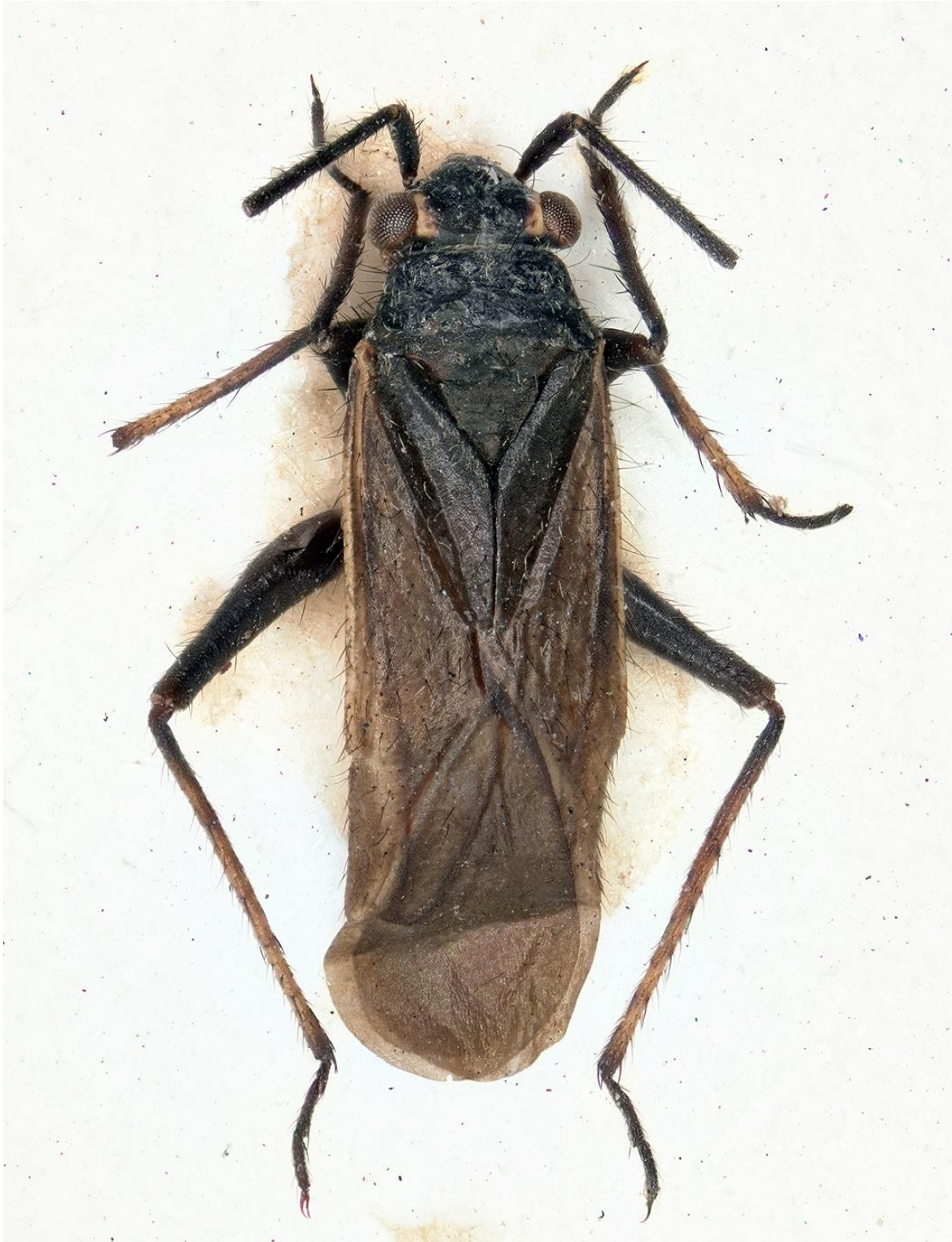
Figura 16. Dimorphocoris (Dimorphocoris) ehannoi Ribes & Ribes, 2001. Holotipus ♂ (CRBA-71791)