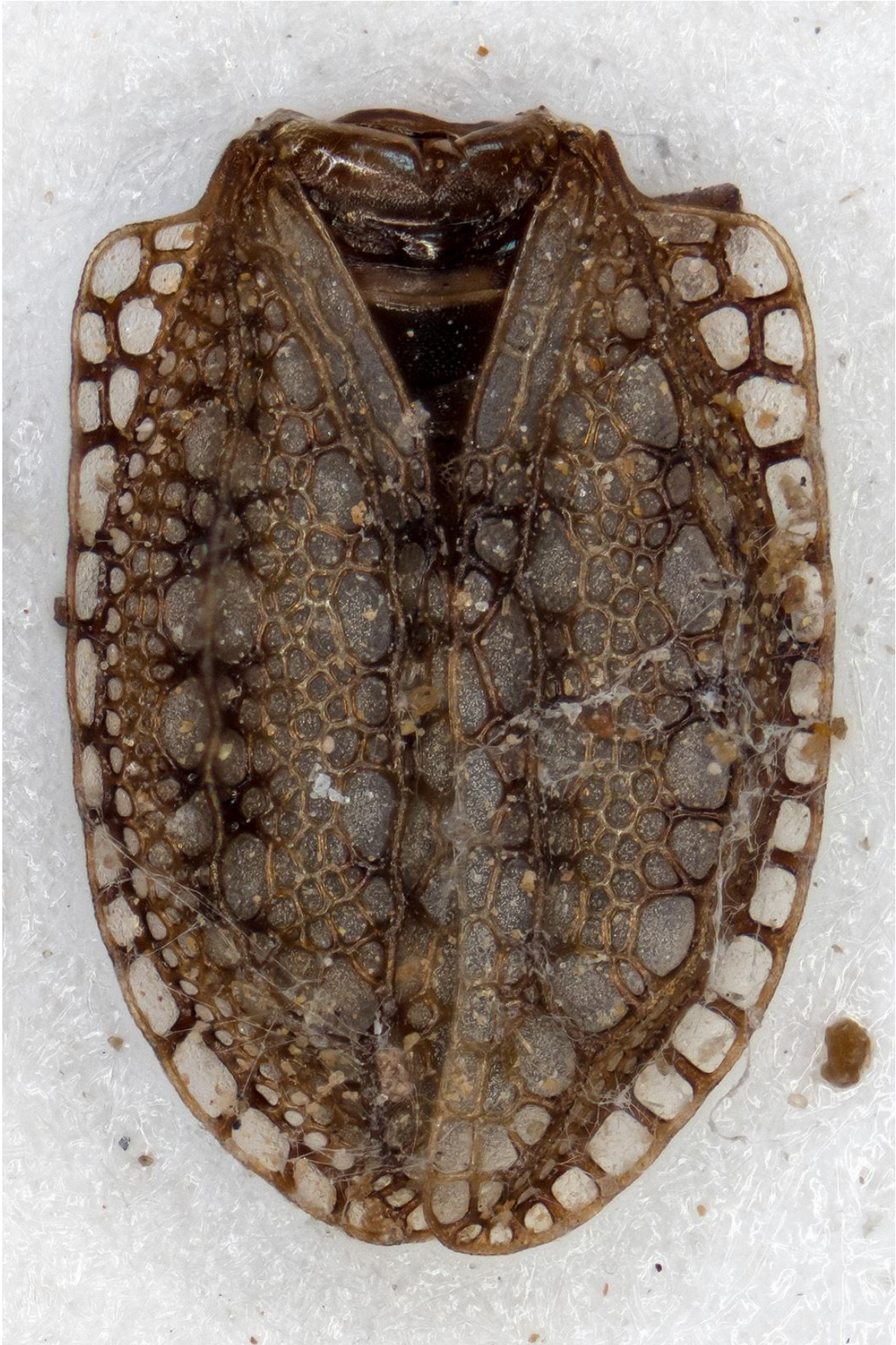
Figura 43. Kalama montisclari Ribes & Pagola-Carte, 2008. Paratipus ♀ (CRBA-76055)