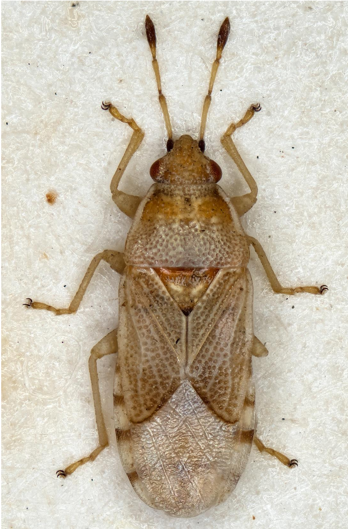
Figura 2. Artheneis wagneri Ribes, 1972. Holotipus ♂ (CRBA-64142)