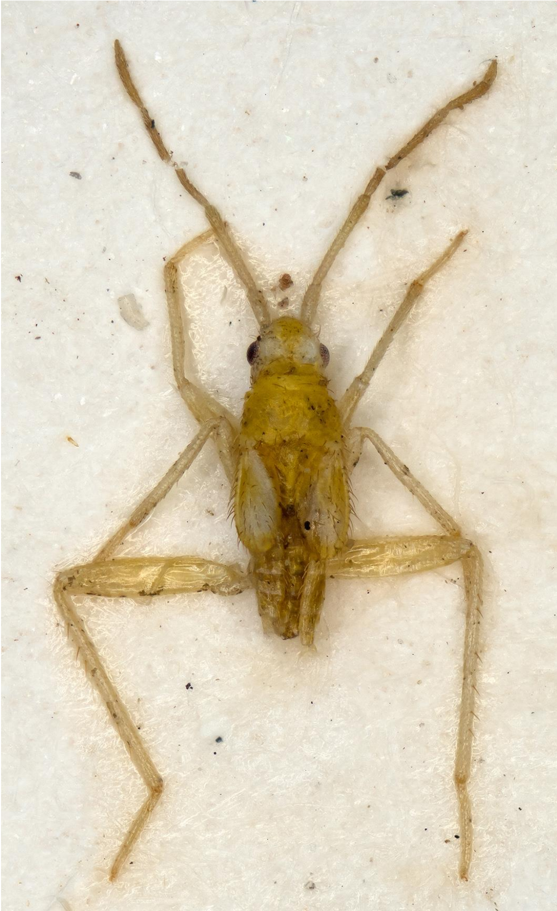
Figura 22. Macrolophus pericarti Ribes & Heiss, 1998. Paratipus ♂ (CRBA-69322)