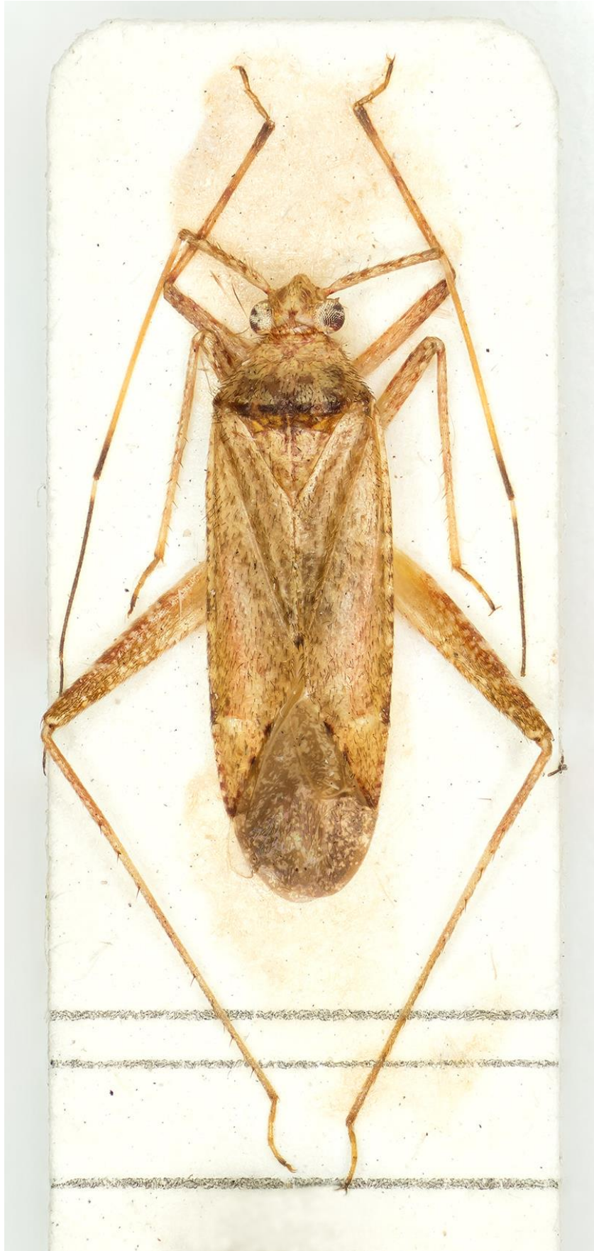
Figura 31. Phytocoris (Compsocerocoris) vallhonrati J. Ribes & E. Ribes, 2000. Holotipus ♂ (CRBA-70589)