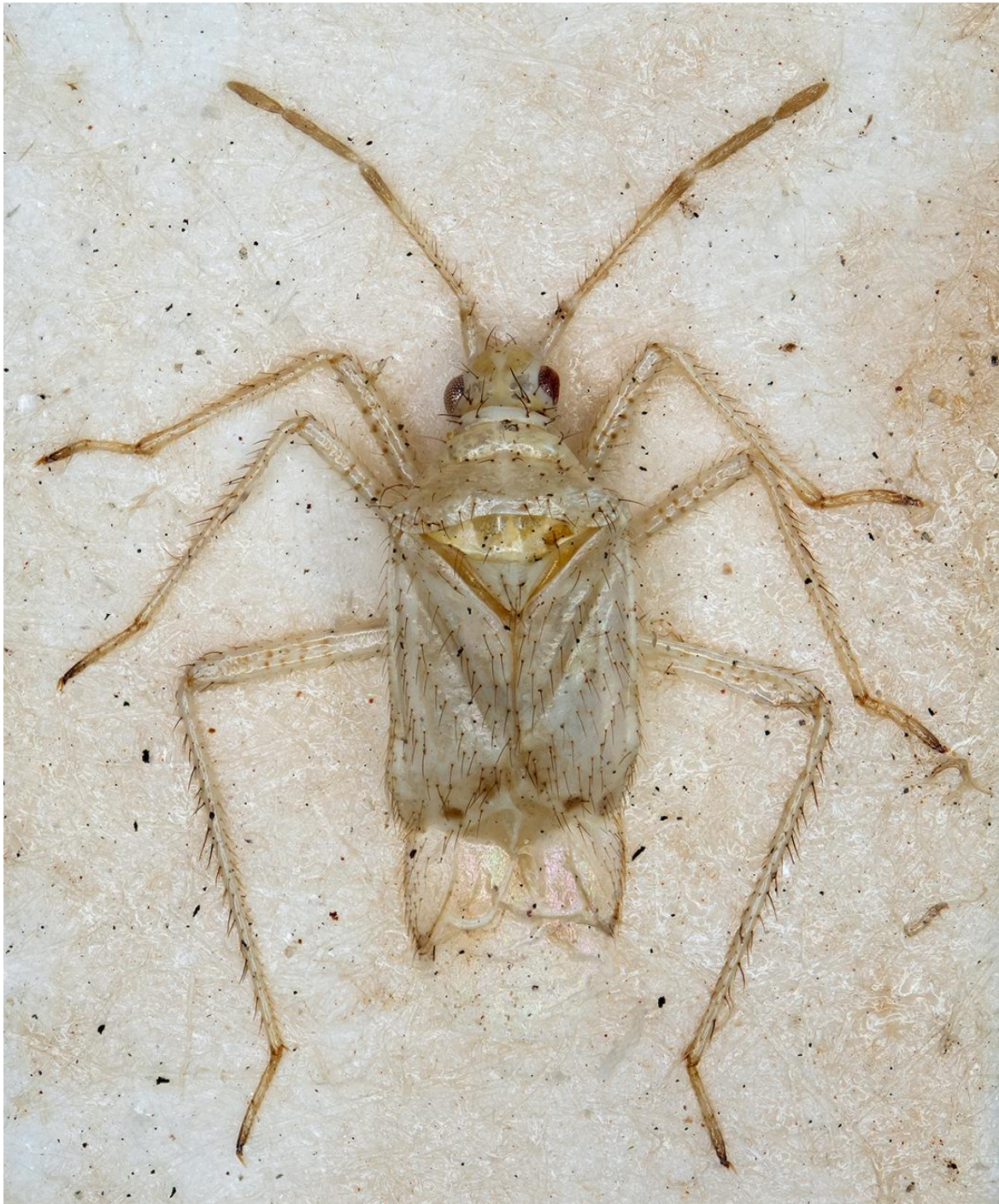
Figura 14. Dicyphus (Dicyphus) tumidifrons Ribes, 1997. Holotipus ♂ (CRBA-69252)