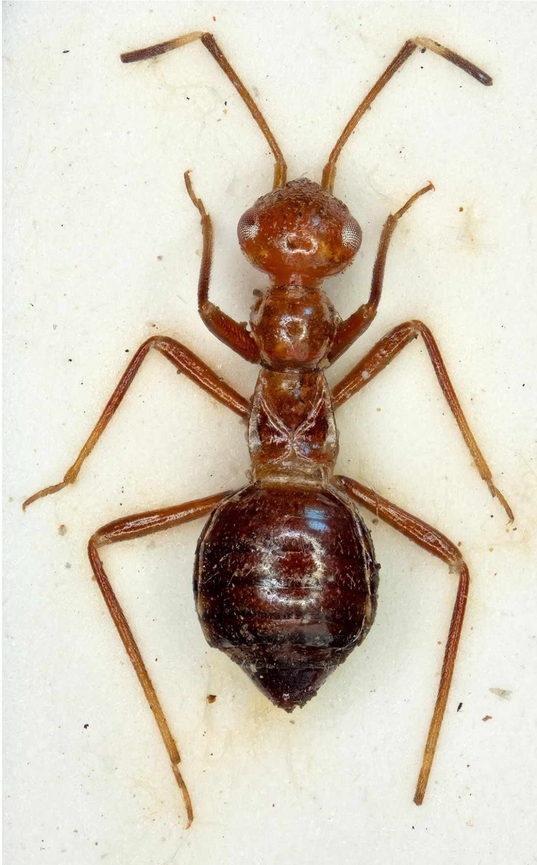
Figura 27. Perenotus stysi (Ribes, Pagola-Carte & Heiss, 2008). Holotipus ♀ (CRBA-73070)