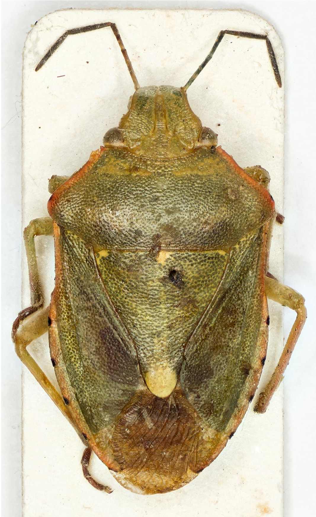
Figura 35. Brachynema purpureomarginatum kerzhneri Ribes & Pagola-Carte, 2007. Paratipus ♂ (CRBA-59214)