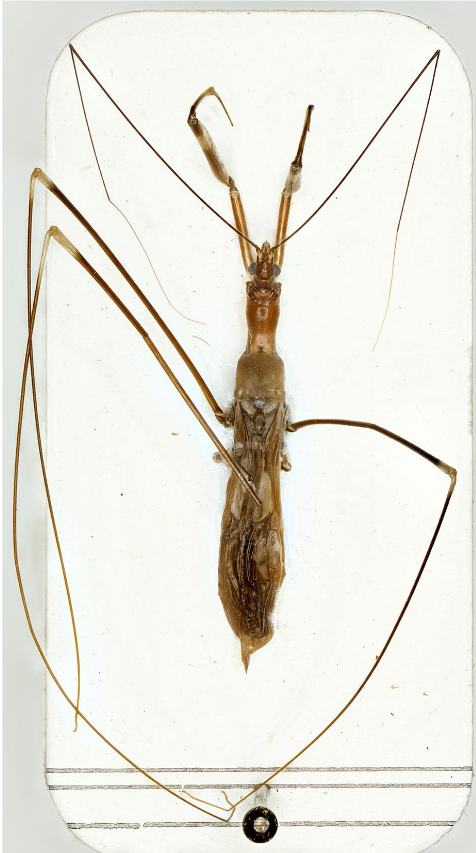
Figura 37. Bagauda furcosus Ribes, 1987. Paratipus ♀ (CRBA-61458)