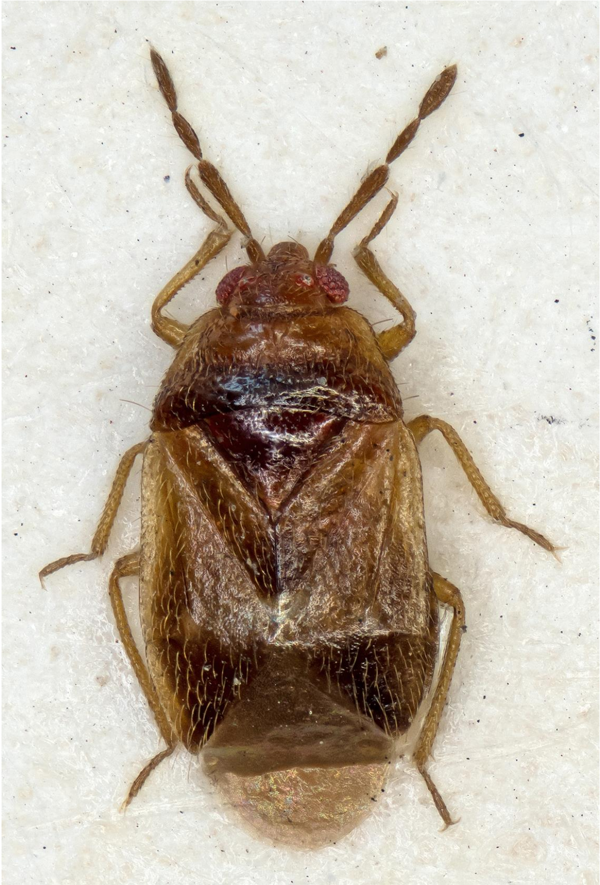
Figura 1. Brachysteles spagnoli Ribes, 1984. Holotipus ♂ (CRBA-68226)