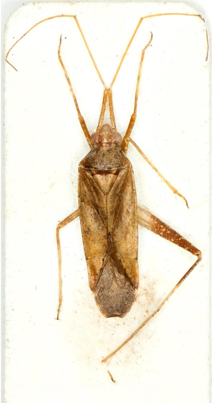
Figura 32. Phytocoris (Ktenocoris) pseudocellatus Ribes & Pagola-Carte, 2009. Holotipus ♂ (CRBA-70788)