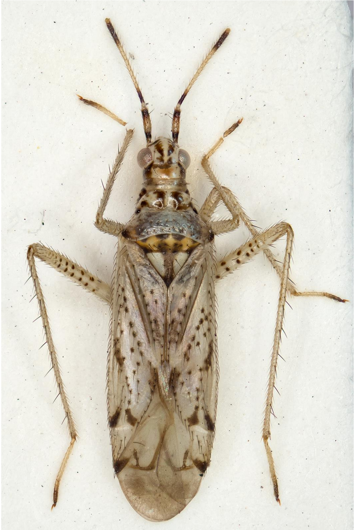
Figura 13. Dicyphus (Dicyphus) poneli Matocq & Ribes, 2004. Paratipus ♂ (CRBA-69233)