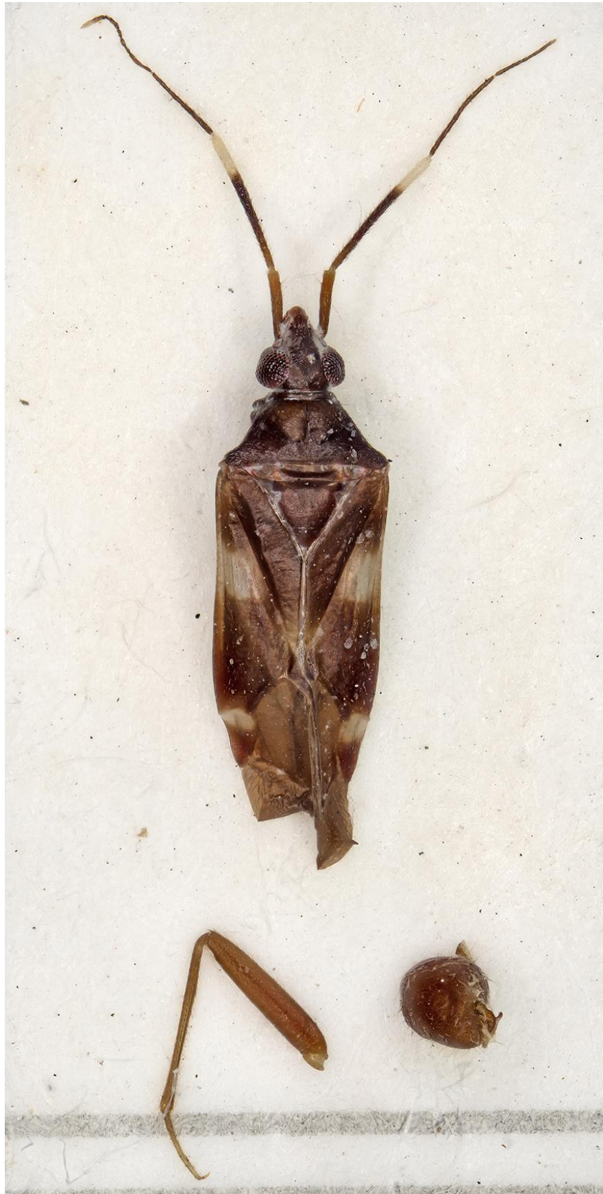
Figura 20. Fulvius borgesii Chérot, Ribes & Gorczyca, 2006. Paratipus ♂ (CRBA-69365)