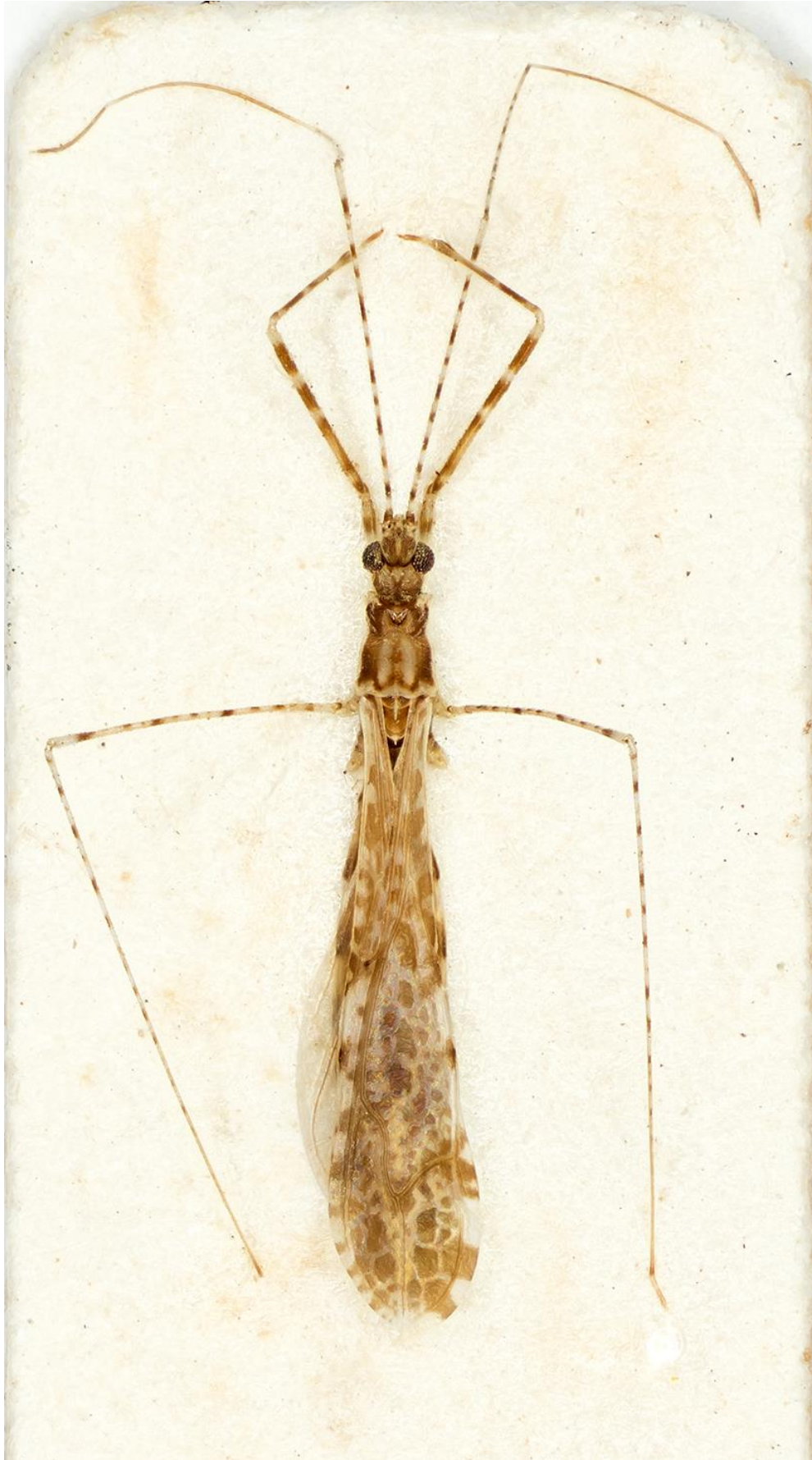
Figura 39. Empicoris tabellarius Ribes & Putschkov, 1992. Holotipus ♂ (CRBA-61403)