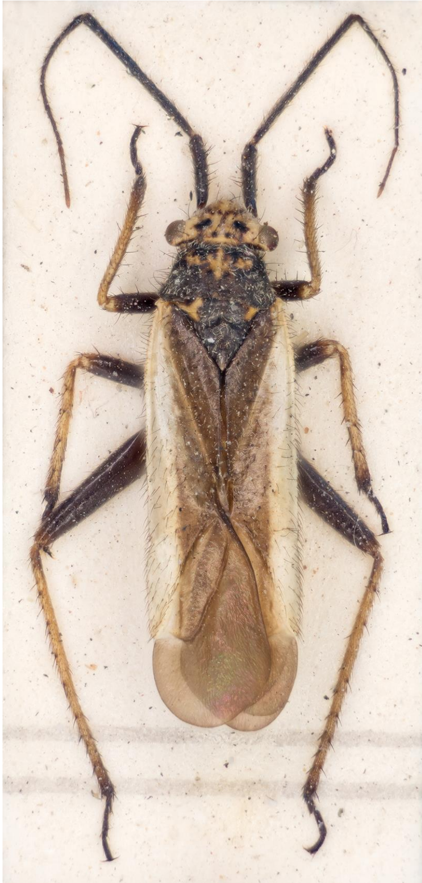
Figura 18. Dimorphocoris (Dimorphocoris) josephinae Ehanno & Ribes, 1994. Paratipus ♂ (CRBA-71695)