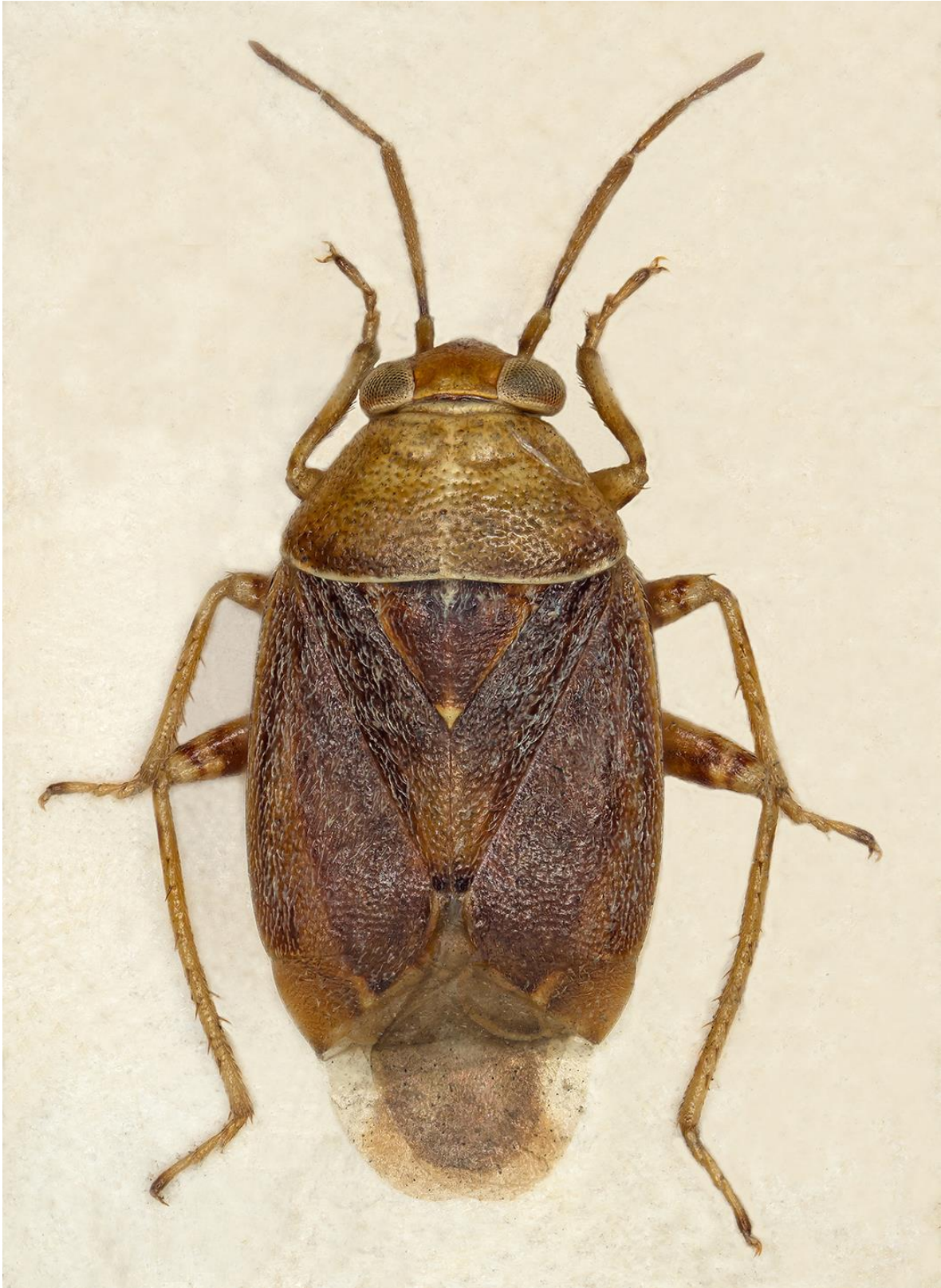
Figura 6. Agnocoris eduardi Ribes, 1977. Holotipus ♂ (CRBA-69634)