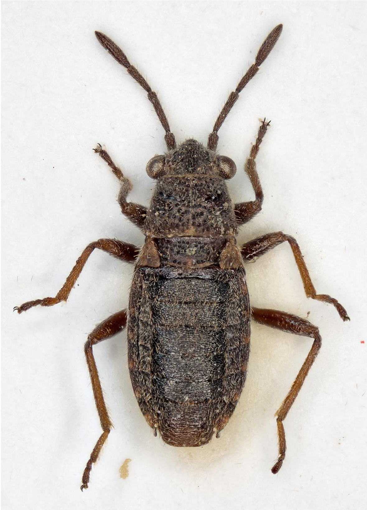
Figura 3. Lygaeosoma streittoi Pagola – Carte & Ribes, 2013. Paratipus ♂ (CRBA-64969)