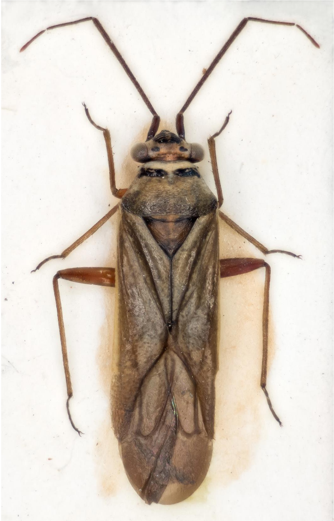
Figura 21. Hyoidea flavolimbata Ribes & Ribes, 2000. Holotipus ♂ (CRBA-72402)