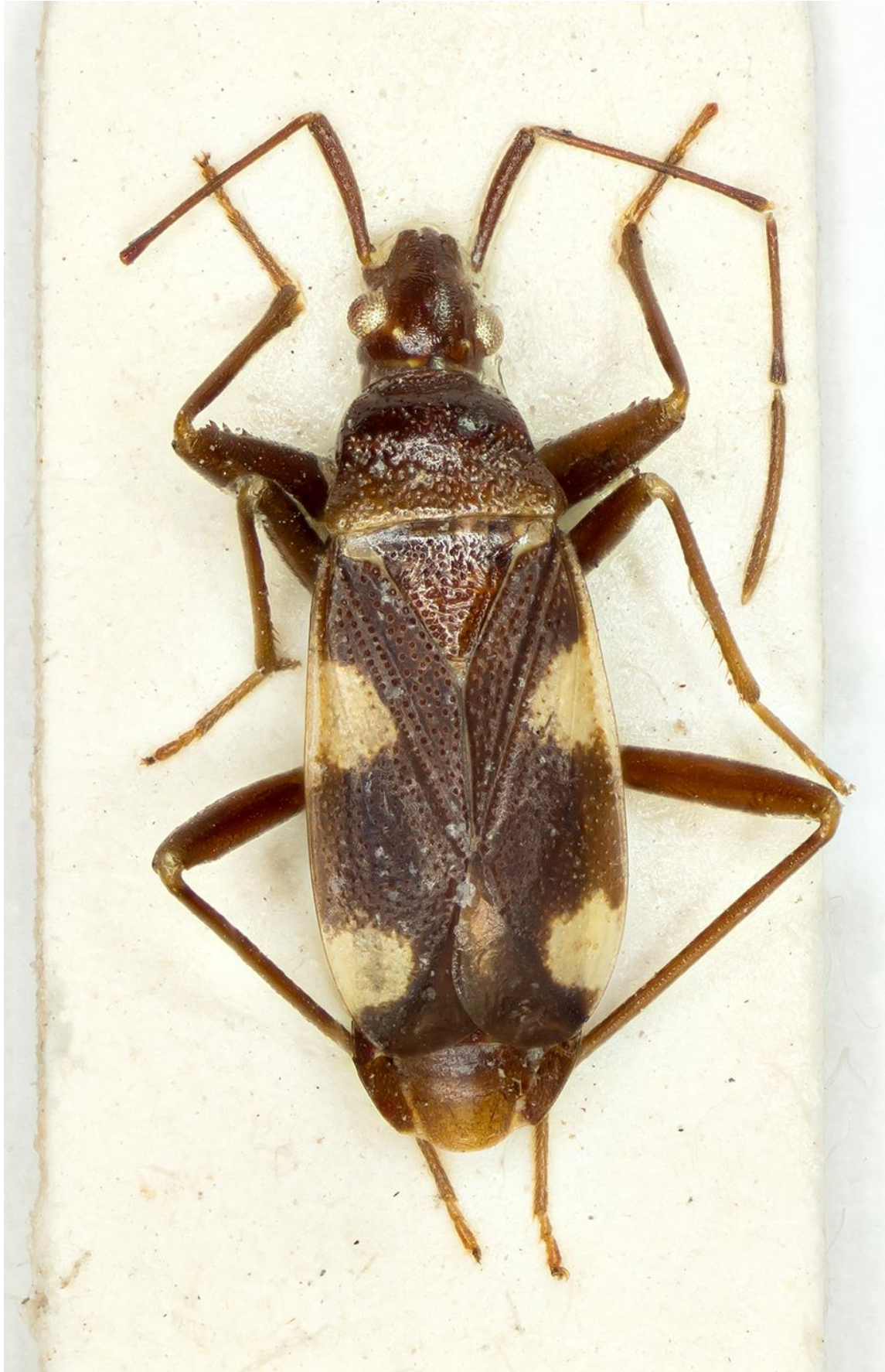
Figura 40. Noulhieria herbanica Ribes, 1976. Holotipus ♂ (CRBA-67100)