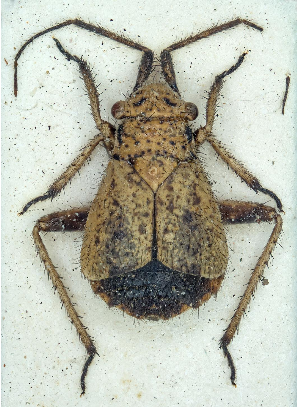
Figura 15. Dimorphocoris (Dimorphocoris) durfortae Ehanno & Ribes, 1994. Paratipus ♂ (CRBA-71650)