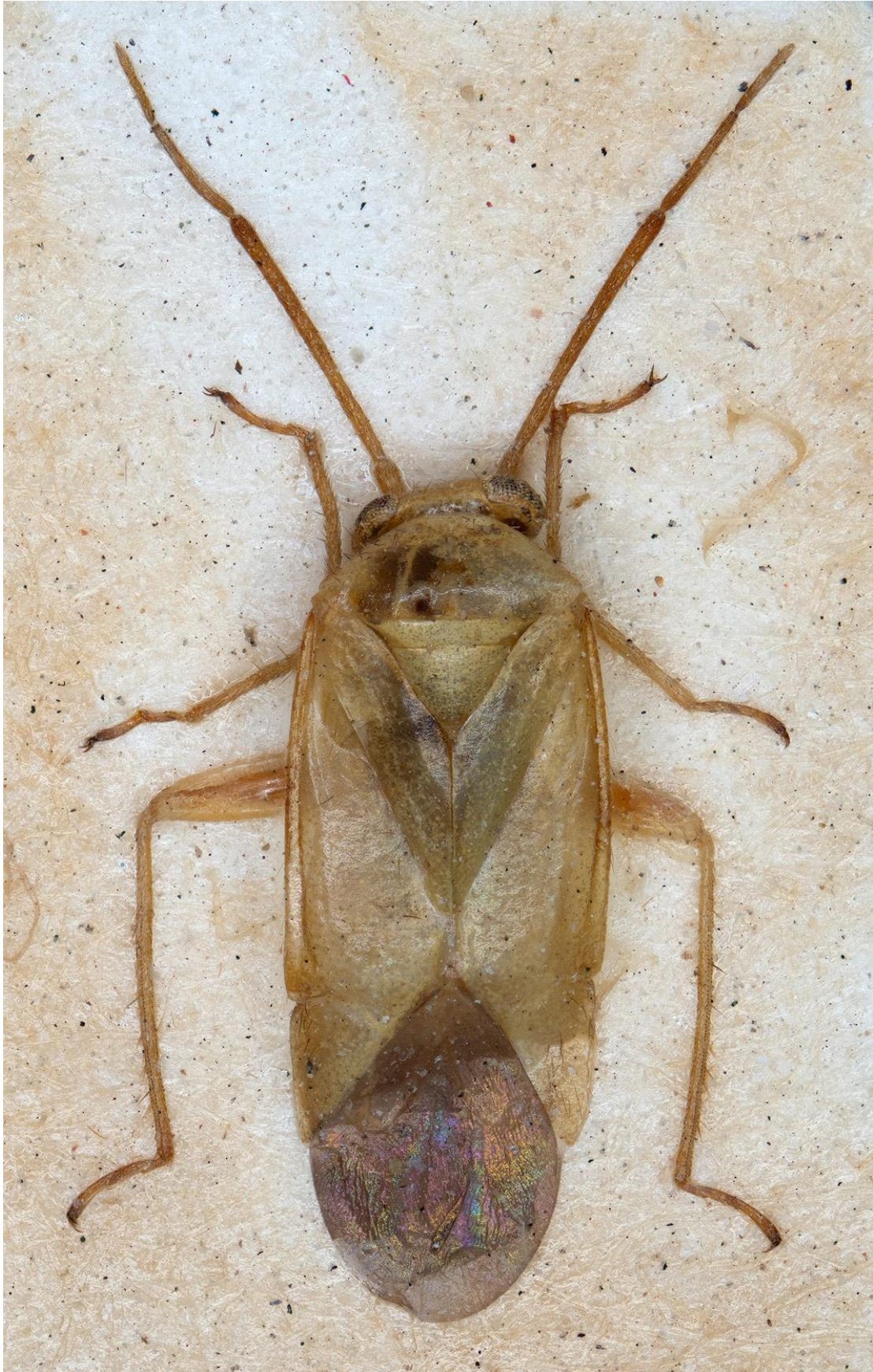
Figura 25. Orthotylus (Neopachylops) junipericola castellanus Ribes, 1978. Holotipus ♂ (CRBA-72816)