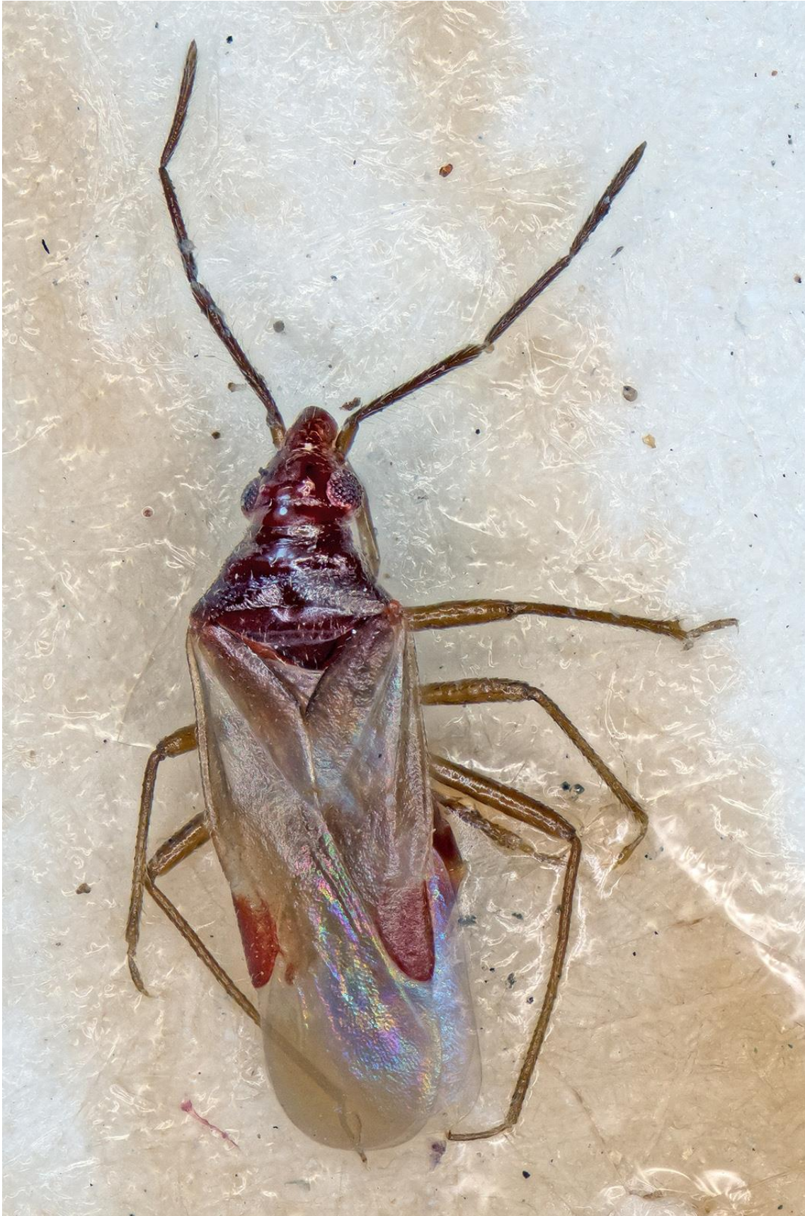
Figura 4. Loricula (Loricula) stenocephala Ribes, 1985. Holotipus ♂ (CRBA-69043)