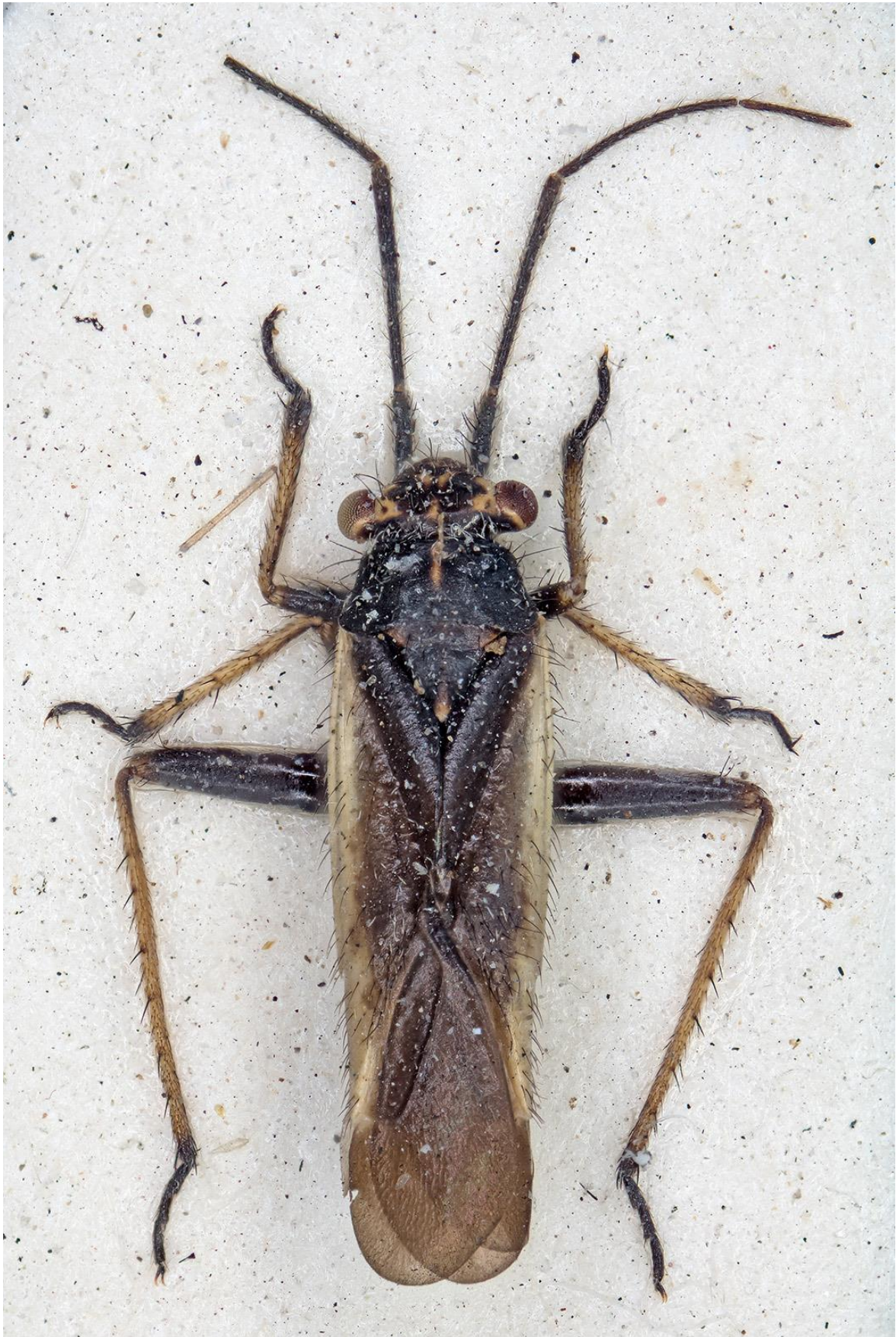
Figura 19. Dimorphocoris (Dimorphocoris) obachi Ehanno & Ribes, 1994. Paratipus ♂ (CRBA-71708)