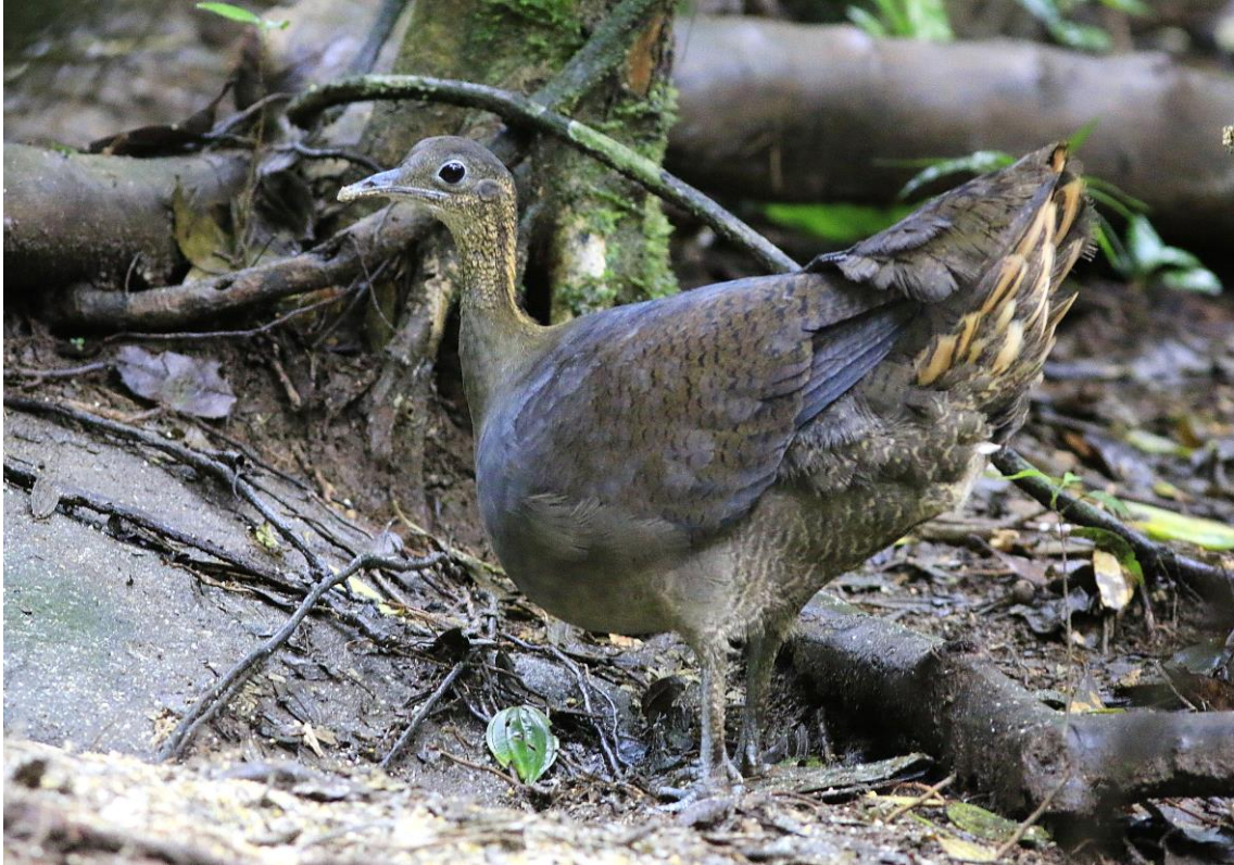
Macuco ( Tinamus solitarius ).