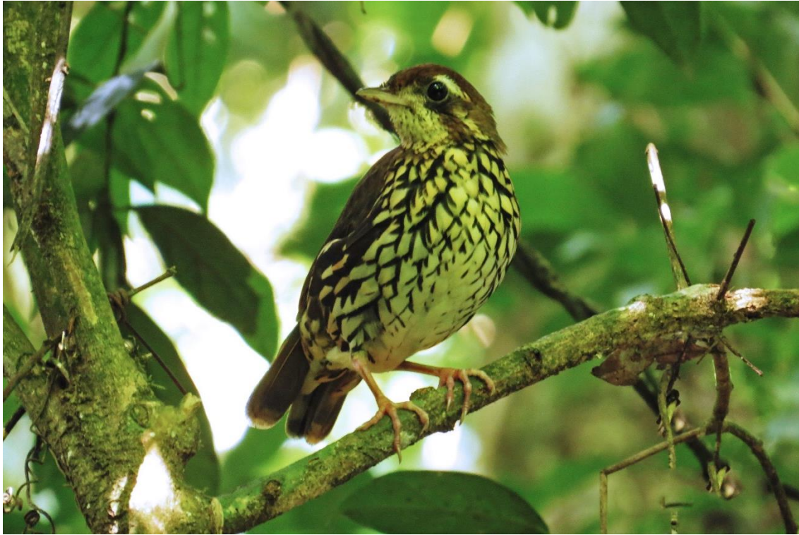
Tovaca-campainha ( Chamaeza campanisona ).