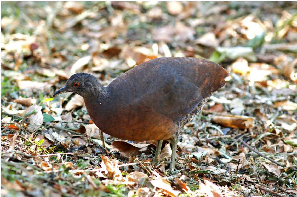
Inhambuguaçu ( Crypturellus obsoletus ).