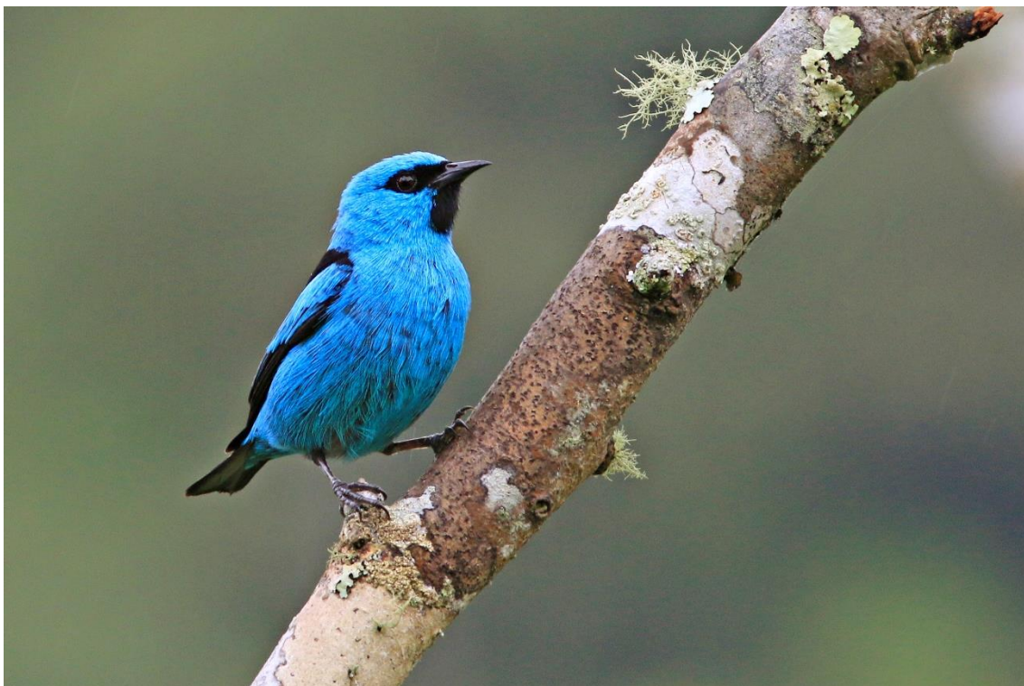
Saí-de-pernas-pretas ( Dacnis nigripes ).