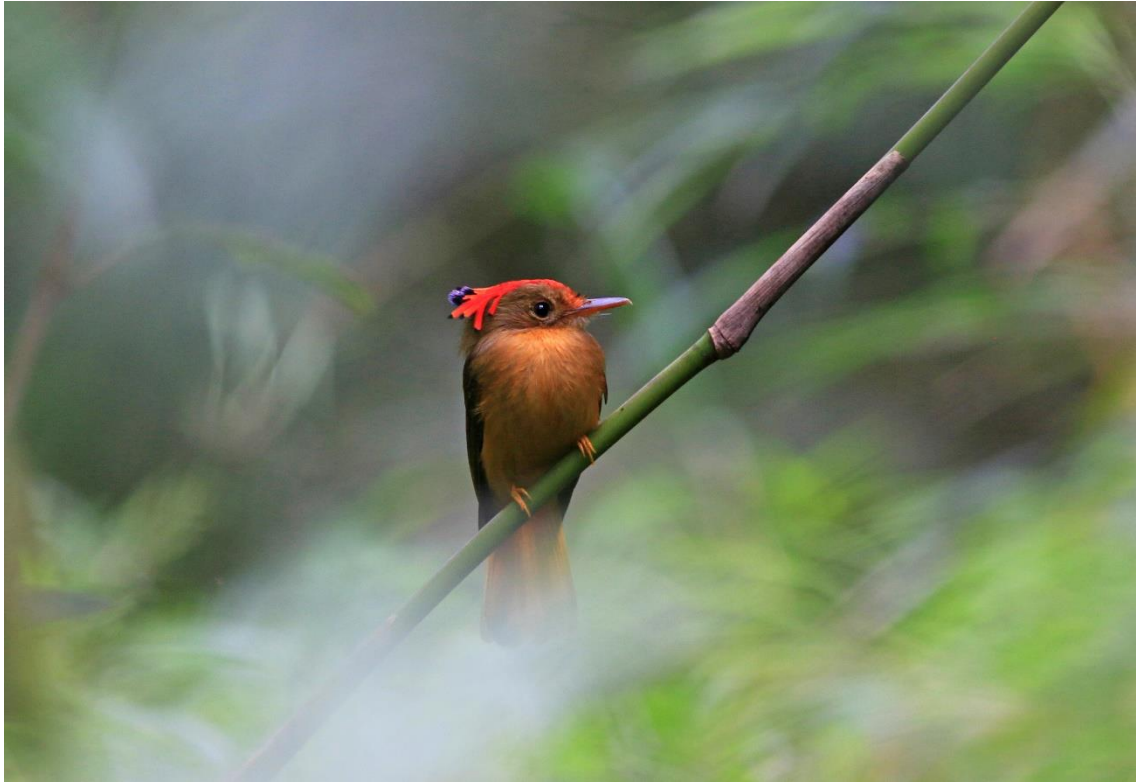
Maria-leque-do-sudeste ( Onychorhynchus swainsoni ).