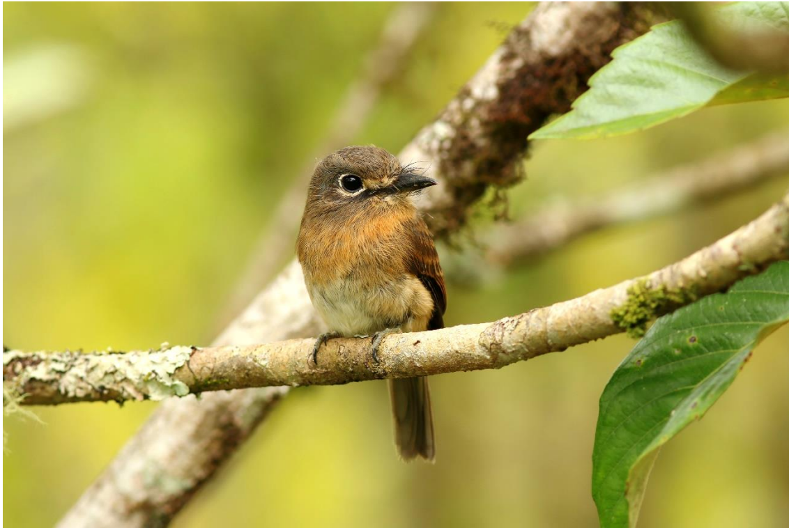
Macuru ( Nonnula rubecula ).