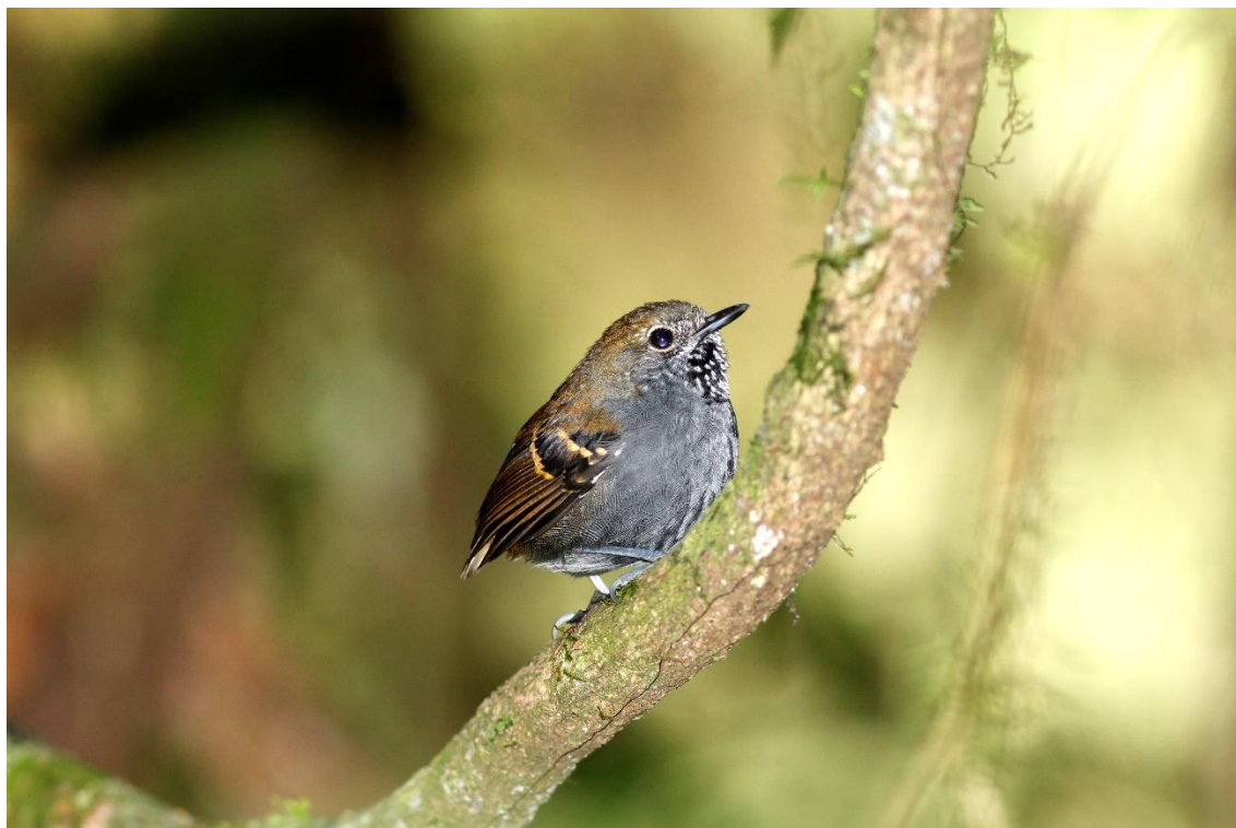
Choquinha-de-garganta-pintada ( Rhopias gularis ).