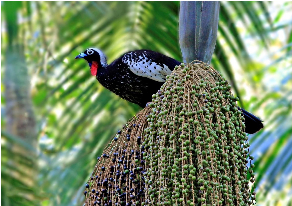
Jacutinga ( Pipile jacutinga ).