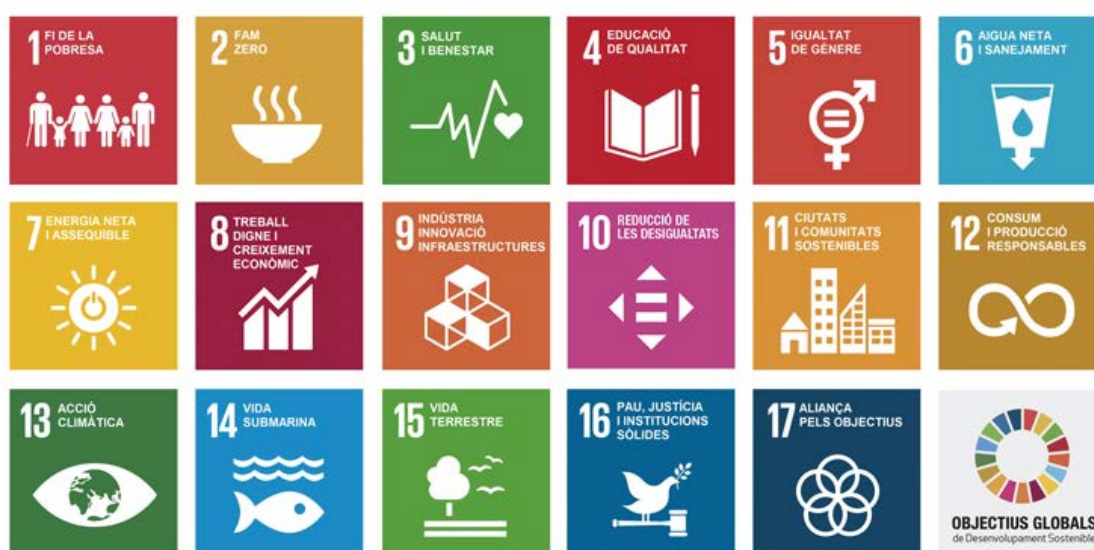
Figura 3. Els Objectius pel Desenvolupament Sostenible, amb la infografia original de la ONU (4).

Els ODS s'organitzen en 17 objectius que es despleguen en 169 metes amb uns indicadors quantificables per avaluar-ne el progrés. Els ODS tenen un abast universal, atès que el seu àmbit d'actuació i compromís afecta tots els països del món, i pretenen garantir que els resultats assolits afectin la totalitat de la població. Els 17 Objectius constitueixen el que es va anomenar l'Agenda 2030 de la humanitat, és a dir, els reptes globals als quals la humanitat ha de fer front per assolir la sostenibilitat l'any 2030.