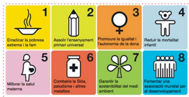
Figura 2. Iconografia dels Objectius del Mil·lenni (3).

Les recomanacions emeses a l'informe van ser el punt de partida de la cimera de Rio al 1992, d'on va sorgir la coneguda com a "Agenda 21" que recollia tot un seguit d'accions a adoptar des del nivell global fins al local per tal de transformar vers la sostenibilitat totes les àrees en què la humanitat impacta en el medi ambient (2). També van començar a gestar-se els anomenats Objectius del Mil·lenni (3), signats per 189 països al setembre del 2000 per l'erradicació de la pobresa i l'avenç igualitari de la Humanitat (Figura 2). Aquests Objectius del Mil·lenni eren els següents: