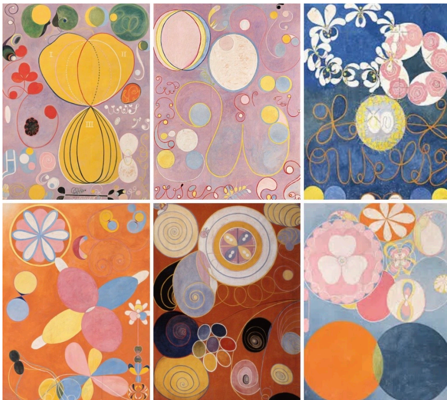
Figura 8. Los cuadros para el temple (selecció de sis de les 193 obres). Hilma Af Klin, 1906-1915

En el moment en què vaig conèixer l'obra d'Af Klint em va impactar, una de les primeres referents de l'art abstracte europeu. El seu treball em va recordar a les formes orgàniques amb les quals jo treballo al llarg de tot aquest projecte, i encara que no fem servir la mateixa gamma cromàtica, els colors escollits i la seva saturació em recorden en gran manera a les tonalitats que he fet servir.