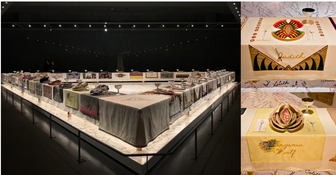
Figura 4. The Dinner Party . Judy Chicago, 1974-1979

Es tracta d'una instal·lació que recrea una gran taula en forma de triangle equilàter, una forma que tradicionalment ha estat vinculada a la feminitat. 4 A cada costat del triangle es disposen tretze serveis individuals, que fa referència a les persones que van assistir a l'últim sopar de Jesucrist, on clarament tots els assistents eren homes. Però en total a la peça de Chicago són trenta-nou serveis al llarg de tota la taula 5 . Cada taula té un ordre concret, la primera acollia a dones des de la Prehistòria fins a l'Imperi Roma, la segona des dels inicis del Cristianisme fins a la Reforma i la tercera i ultima, des de la Revolució Americana fins al moment en què l'obra va ser creada.