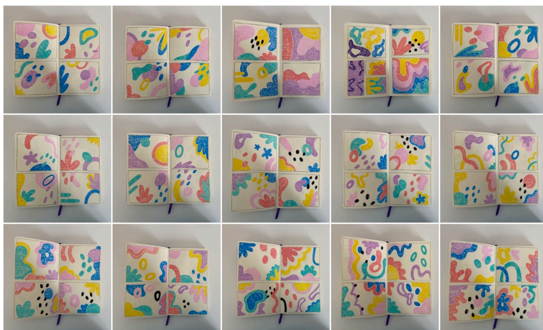
Figura 6. Primers esbossos del TFG

Pel que fa a la gamma, vaig escollir aquests colors tan vibrants, són els creadors de vida, els protagonistes, ens mostren com les formes orgàniques van mutant i evolucionant entre elles, creant noves formes de vida a mesura que s'ajunten i se separen. En escollir aquests colors jugava amb l'imaginari que sempre tenim quan es tracta les malalties mentals, que sempre visualitzen colors foscos i apagats.