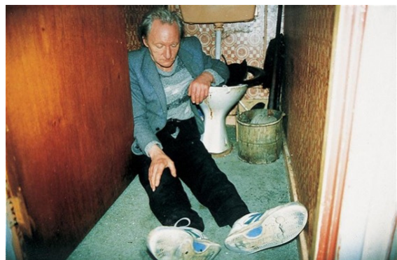
Ray's a laugh - Richard Billingham