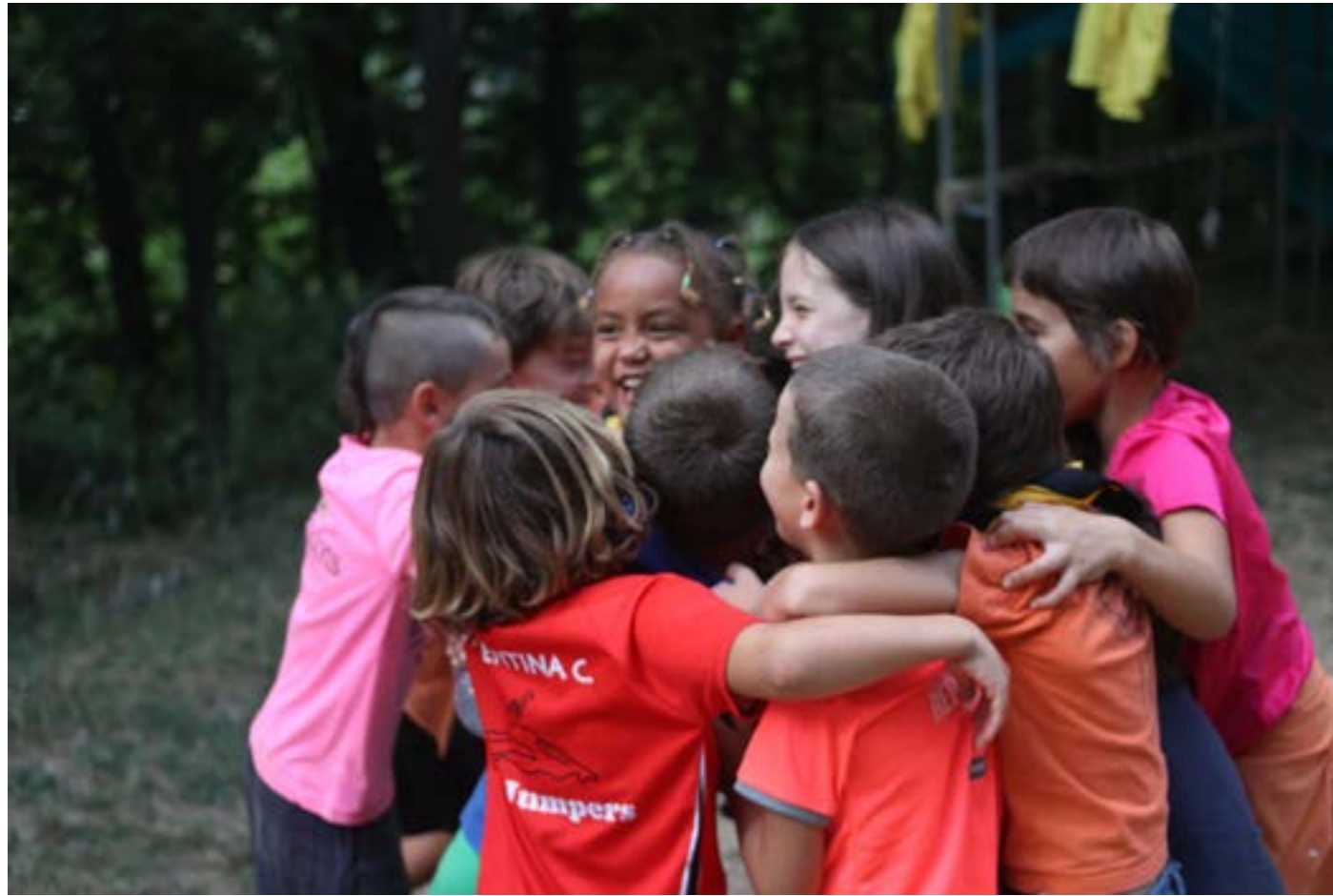
QUE HAVIA APRÉS A ESTIMAR