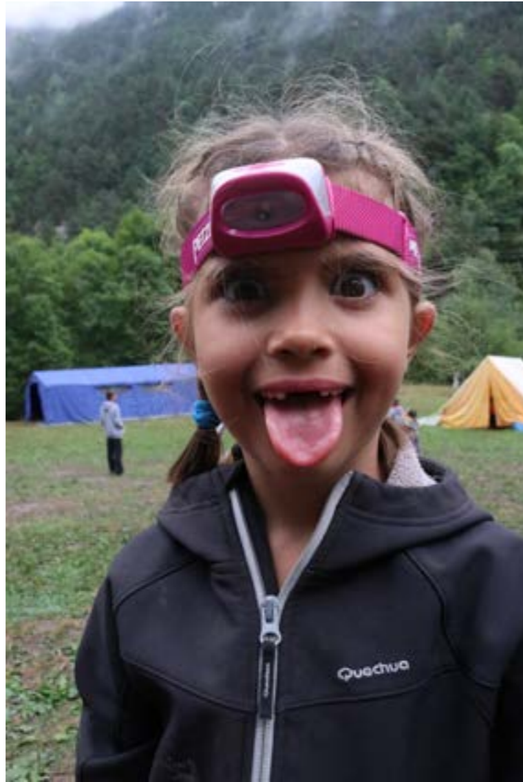
QUE ALGÚNS DIES ESTAVA MOLT PESADA