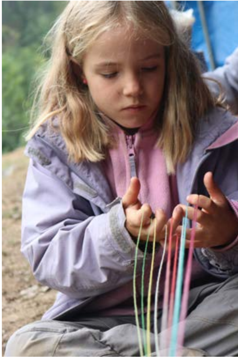
QUE APRENDRE TAMBÉ ENTRAVA DINS DELS MEUS PLANS