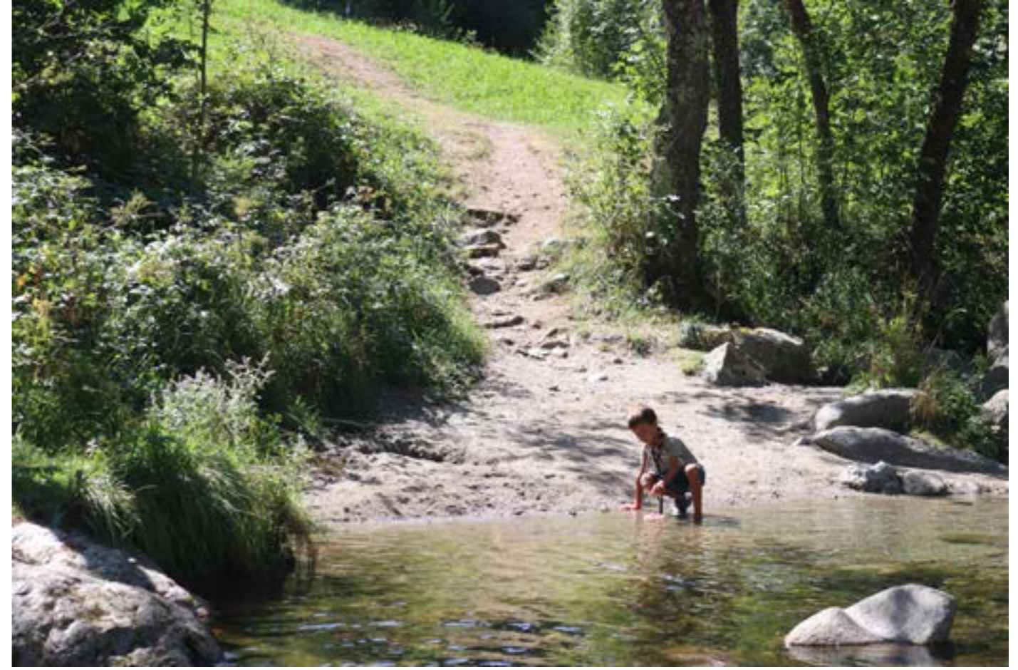
QUE LA CURIOSITAT HAVIA FET PROCUPAR ELS PARES