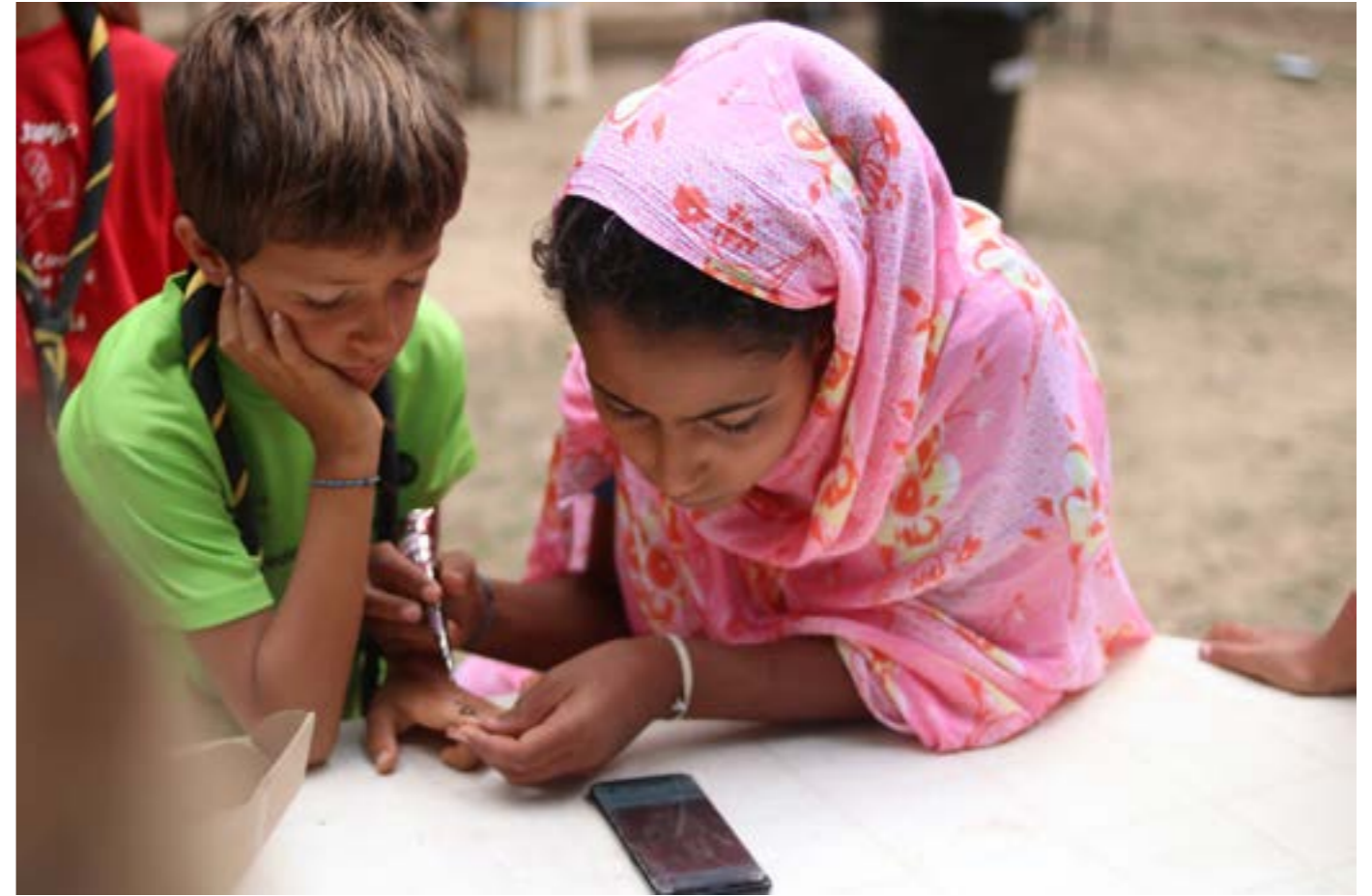
QUE AJUDAR SEMPRE VA BÉ