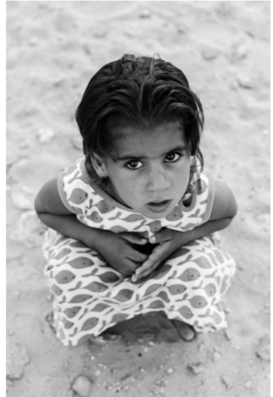
QUE DE VEGADES HAVIA PASSAT MOLTA PORA