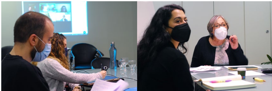
Sessió de classe, desembre de 2021. Lloc: Societat Espanyola de Psicoanàlisi.

Els docents que formen part de l'equip del màster son professionals psicòlegs, psiquiatres, psicoterapeutes i/o psicoanalistes amb una alta qualificació, implicats en l'assistència pública.