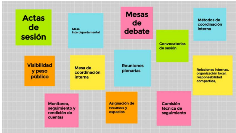
Ejemplo de elementos para la interlocución intermunicipal.

Compartir en gran grupo los elementos que cada persona participante ha destacado, mientras una persona toma nota en una pizarra o en un papel colocado en la pared, o bien utilizando una pizarra digital interactiva. En este momento, se abre un espacio para deliberar.