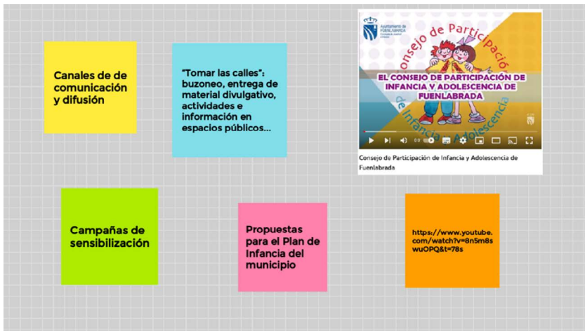
Ejemplo de estrategias para incluir a NNA y visibilizar la participación.

Cuando el grupo de NNA dispone del producto, los avances y/o las aportaciones, ¿cómo implica a sus iguales?, ¿cómo eleva toda su creación, trabajo, etc. a la sociedad?