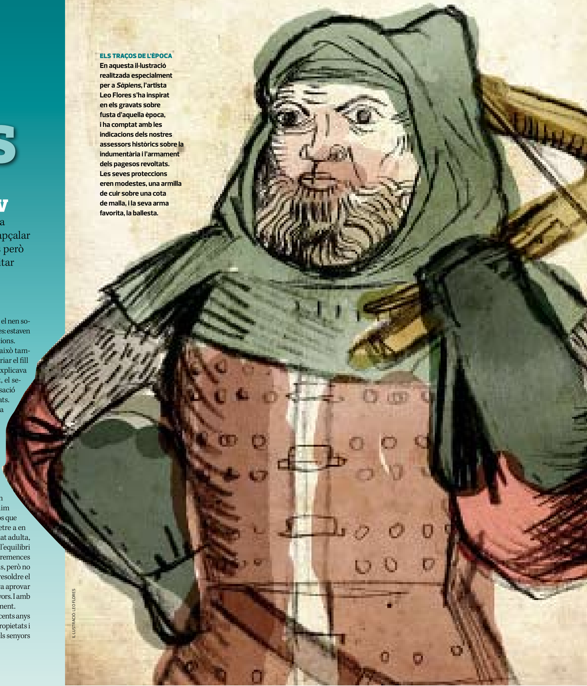
IL·LUSTRACIÓ: LEO FLORES

En aquesta il·lustració realitzada especialment per a Sàpiens , l'artista Leo Flores s'ha inspirat en els gravats sobre fusta d'aquella època, i ha comptat amb les indicacions dels nostres assessors històrics sobre la indumentària i l'armament dels pagesos revoltats. Les seves proteccions eren modestes, una armilla de cuir sobre una cota de malla, i la seva arma favorita, la ballesta.